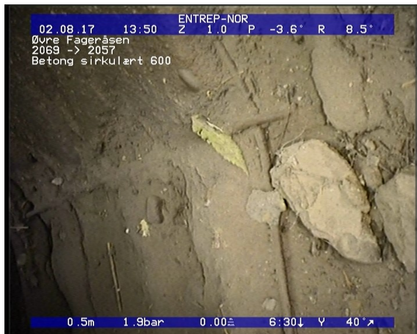
Foto: 47_47_952_A.JPG 0,5m, Korrosjon/Slitasje, Manglende tilslag (rørveggen er sterkt påvirket), I bertongrør er tilslagsmaterialet delvis borte eller armering synlig, fra 04 til 08 Kl., Start