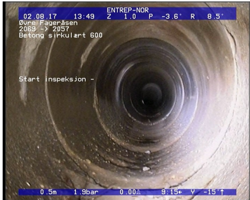
Foto: 47_47_47_A.JPG 0,5m, Start inspeksjon -