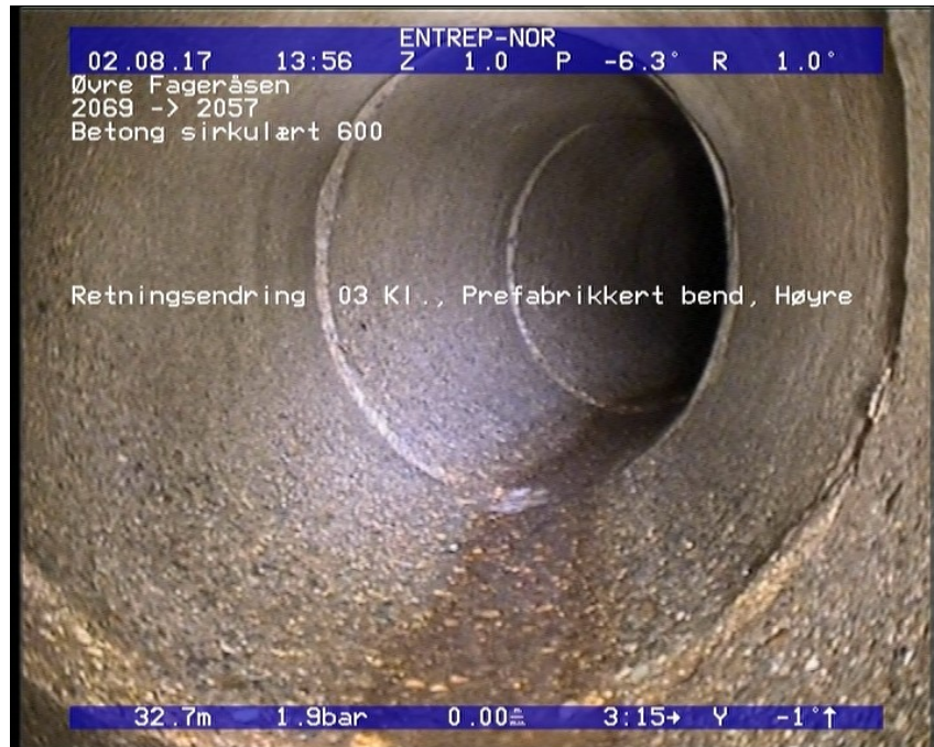
Foto: 47_47_954_A.JPG 32,73m, Retningsendring 03 Kl., Prefabrikkert bend, Høyre