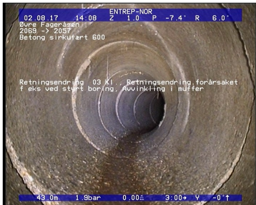
Foto: 47_47_957_A.JPG 43,04m, Retningsendring 03 Kl., Retningsendring forårsaket f eks ved styrt boring, Avvinkling i muffer