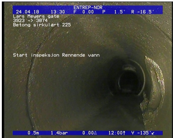
Foto: Start inspeksjon Rennende vann_1333480,5_SI.JPG 0,5m, Start inspeksjon Rennende vann