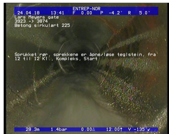
Foto: Sprukket rør, sprekken er åpne/løse teglstein, fra 12 til 12 Kl., Kompleks, Start_13451828,33_.JPG 28,33m, Sprukket rør, sprekken er åpne/løse teglstein, fra 12 til 12 Kl., Kompleks, Start