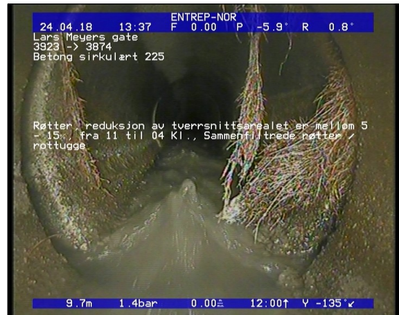
Foto: Røtter, reduksjon av tverrsnittsarealet er mellom 5 - 15%, fra 11 til 04 Kl., Sammenfiltrede røtter.JPG 9,7m, Røtter, reduksjon av tverrsnittsarealet er mellom 5 - 15%, fra 11 til 04 Kl., Sammenfiltrede røtter / rottugge