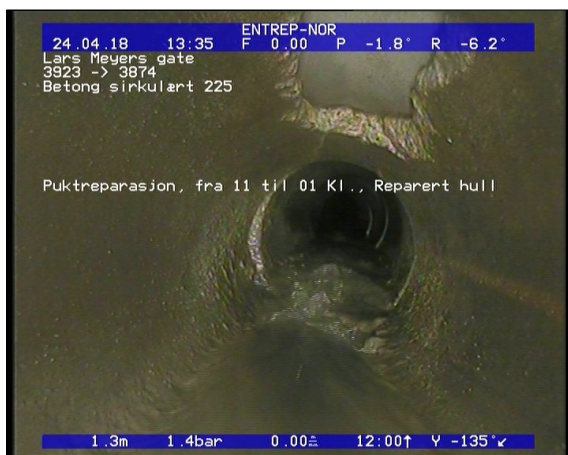
Foto: Puktreparasjon, fra 11 til 01 Kl., Reparert hull_1338551,36_PR.JPG 1,36m, Puktreparasjon, fra 11 til 01 Kl., Reparert hull