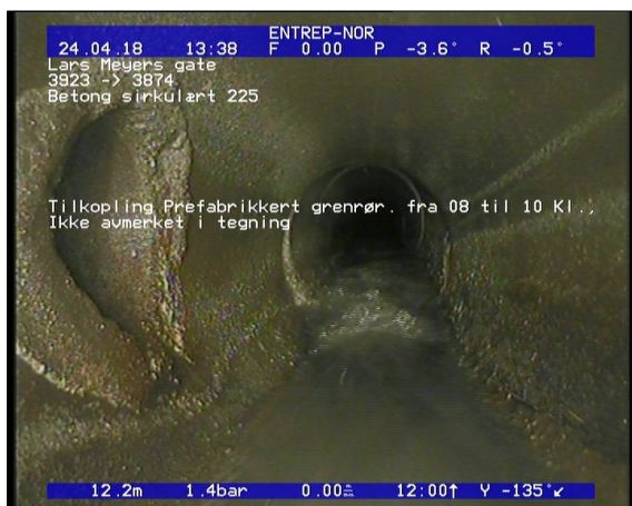
Foto: Tilkopling Prefabrikkert grennrør, fra 08 til 10 Kl., Ikke avmerket i tegning_13414812,28_TK.JPG 12,28m, Tilkopling Prefabrikkert grennrør, fra 08 til 10 Kl., Ikke avmerket i tegning