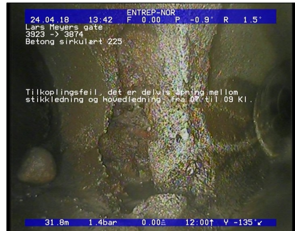
Foto: Tilkoplingsfeil, det er delvis åpning mellom stikkledning og hovedledning, fra 07 til 09 Kl._13.JPG 31,81m, Tilkoplingsfeil, det er delvis åpning mellom stikkledning og hovedledning, fra 07 til 09 Kl.