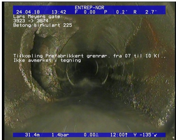
Foto: Tilkopling Prefabrikkert grennrør. fra 07 til 10 Kl., Ikke avmerket i tegning_13460031,47_TK.JPG 31,47m, Tilkopling Prefabrikkert grennrør. fra 07 til 10 Kl., Ikke avmerket i tegning