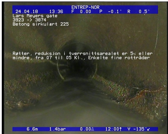
Foto: Røtter, reduksjon i tverrsnittsarealet er 5 eller mindre, fra 07 til 05 Kl., Enkelte fine røtter.JPG 6,69m, Røtter, reduksjon i tverrsnittsarealet er 5% eller mindre, fra 07 til 05 Kl., Enkelte fine rottråder, Start