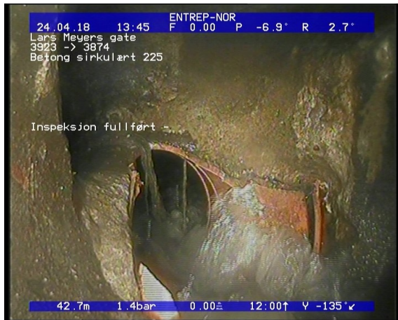
Foto: Inspeksjon fullført -_13485042,75_IF.JPG 42,75m, Inspeksjon fullført -