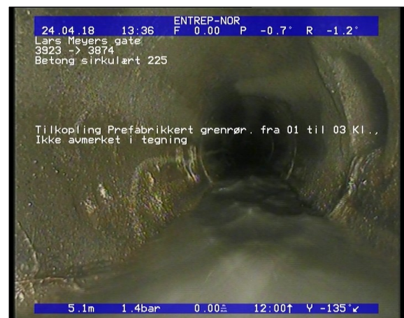
Foto: Tilkopling Prefabrikkert grennrør. fra 01 til 03 Kl., Ikke avmerket i tegning_1340085,17_TK.JPG 5,17m, Tilkopling Prefabrikkert grennrør. fra 01 til 03 Kl., Ikke avmerket i tegning