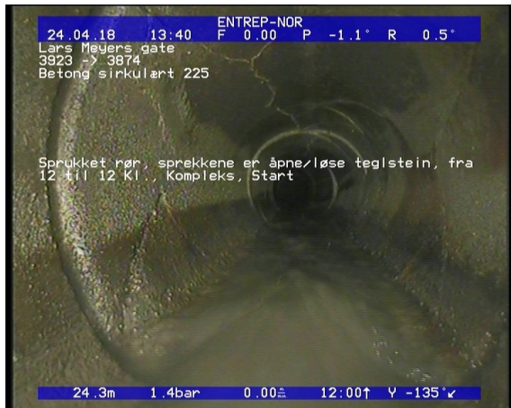
Foto: Sprukket rør, sprekken er åpne/løse teglstein, fra 12 til 12 Kl., Kompleks, Start_13435124,35_.JPG 24,35m, Sprukket rør, Rørbiter har løsnet eller mangler/teglstein mangler fra sin opprinnlige posisjon, fra 12 til 12 Kl., Kompleks, Start