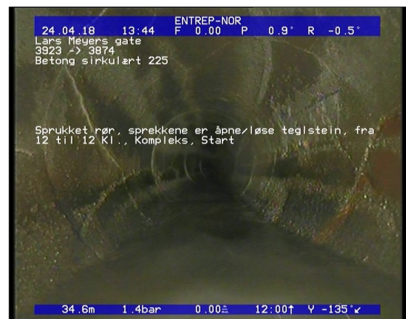
Foto: Sprukket rør, sprekke er åpne/løse teglstein, fra 12 til 12 Kl., Kompleks, Start_13474434,68_.JPG 34,68m, Sprukket rør, sprekke er åpne/løse teglstein, fra 12 til 12 Kl., Kompleks, Start