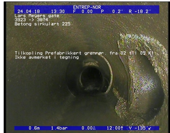
Foto: Tilkopling Prefabrikkert grennrør. fra 02 til 05 Kl., Ikke avmerket i tegning_1334200,61_TK.JPG 0,61m, Tilkopling Prefabrikkert grennrør. fra 02 til 05 Kl., Ikke avmerket i tegning