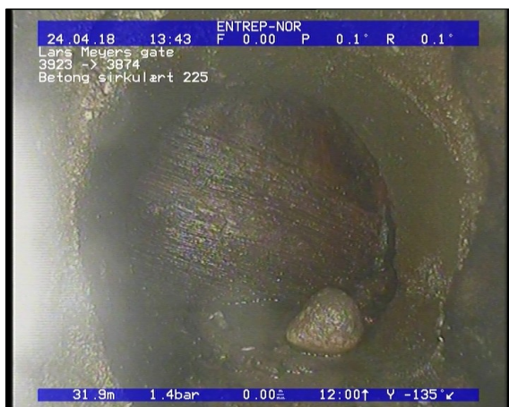
Foto: Plugget tilkopling fra 07 til 10 Kl._13465331,9_PT.JPG 31,9m, Plugget tilkopling fra 07 til 10 Kl.