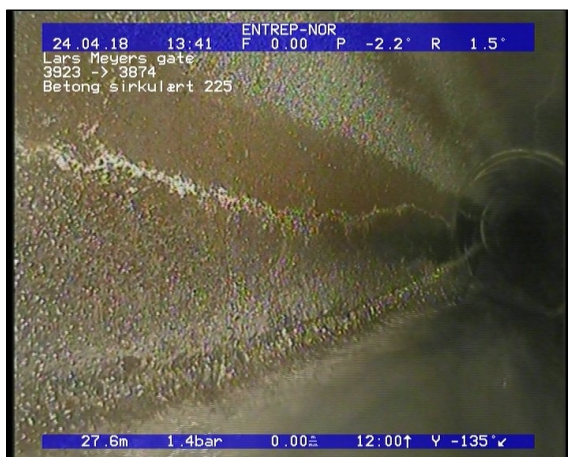
Foto: Sprukket rør, sprekken er åpne/løse teglstein, fra 07 til 08 Kl., Langsående_13445727,66_SR2.JPG 27,66m, Sprukket rør, sprekken er åpne/løse teglstein, fra 07 til 08 Kl., Langsående