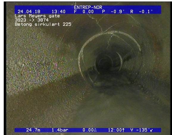
Foto: Sprukket rør, Rørbiter har løsnet eller mangler/teglstein mangler fra sin opprinnlige posisjon, .JPG 24,35m, Sprukket rør, Rørbiter har løsnet eller mangler/teglstein mangler fra sin opprinnlige posisjon, fra 12 til 12 Kl., Kompleks, Start