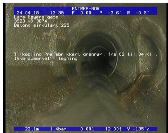
Foto: Tilkopling Prefabrikkert grennrør, fra 02 til 04 Kl., Ikke avmerket i tegning_13431322,12_TK.JPG 22,12m, Tilkopling Prefabrikkert grennrør, fra 02 til 04 Kl., Ikke avmerket i tegning