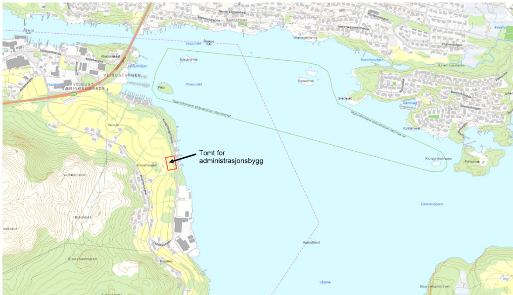
Figur 1 – Oversiktskart byggeområde