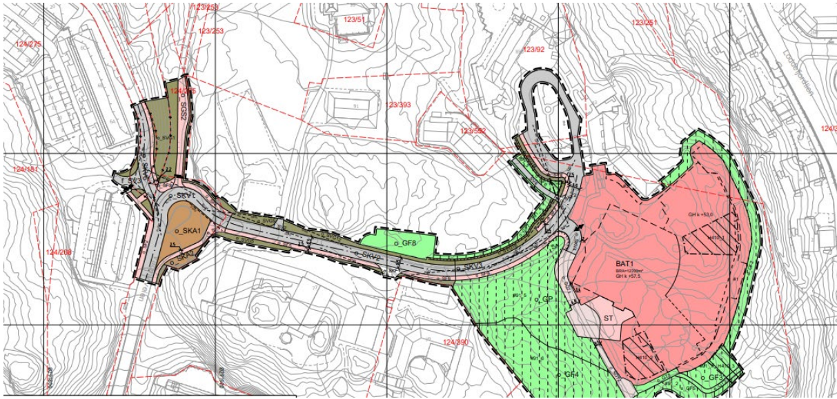
Utklipp fra vedtatt reguleringsplan