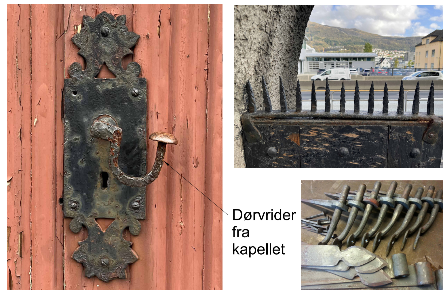
Dørvider fra kapellet

PORT 2 er en rekonstruksjon av opprinnelig port som ble bygget i 1917.