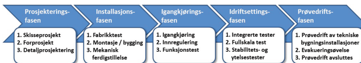
Figur 1 – Faser i byggeprosesser. Figur fra NS 6450.

Dette ivaretas av en strukturert trinnvis prosess, planlagt og styrt av byggeiers organisasjon fra oppstart prosjektering til avsluttet prøvedrift. Systematisk ferdigstillelse skal derfor ivareta beskrevne krav over tid i prosjektet ulike faser: