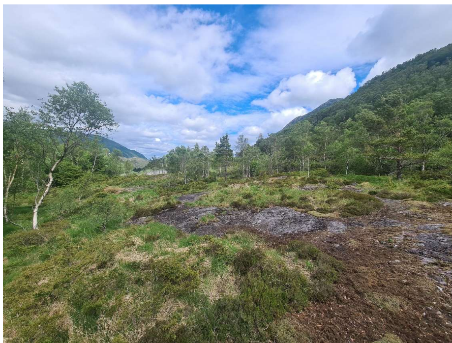
Riggområdet sett mot nord.

Lysegrønt felt viser de ca. 2000 m 2 som er avsatt til riggområde. Merk at grensen går parallelt med Moldalia, noen meter øst for denne. Nord er opp.