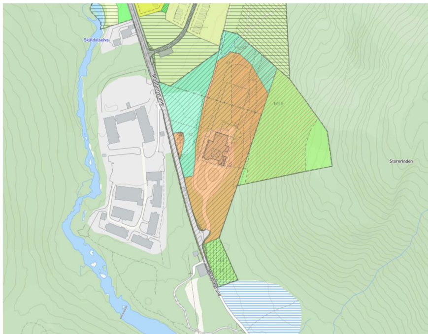
Utklipp fra reguleringsplan over rigg- og anleggsområde

Langs hele anleggets vestside, og parallelt med råvannsledningen, går det en traktorveg/gangveg (nordre del) som går over i en sti (søndre del). Denne benyttes av turgåere og må i anleggsfasen legges om slik at det er mulig å gå utenom anleggsområdet. Stien skal gruses i en meter bredde slik at den er gangbar. E21 er ansvarlig for dette. Se riggplan.