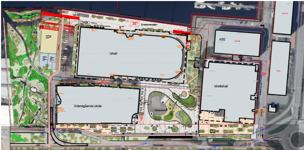
Skissen viser planområdet FMV1 (Fredrikstad mekaniske verksted, planområde 1) med Parkgata øst nederst.

Eiendommen hvor Arena Fredrikstad og Frederik II videregående skole er tenkt etablert er nå fradelt. Tinglysning av eiendommene, oppgjøret og overføring av eiendommene til henholdsvis Fredrikstad kommune (eiendom én) og Viken fylkeskommune (eiendom to og tre) ble slutført i desember 2023.