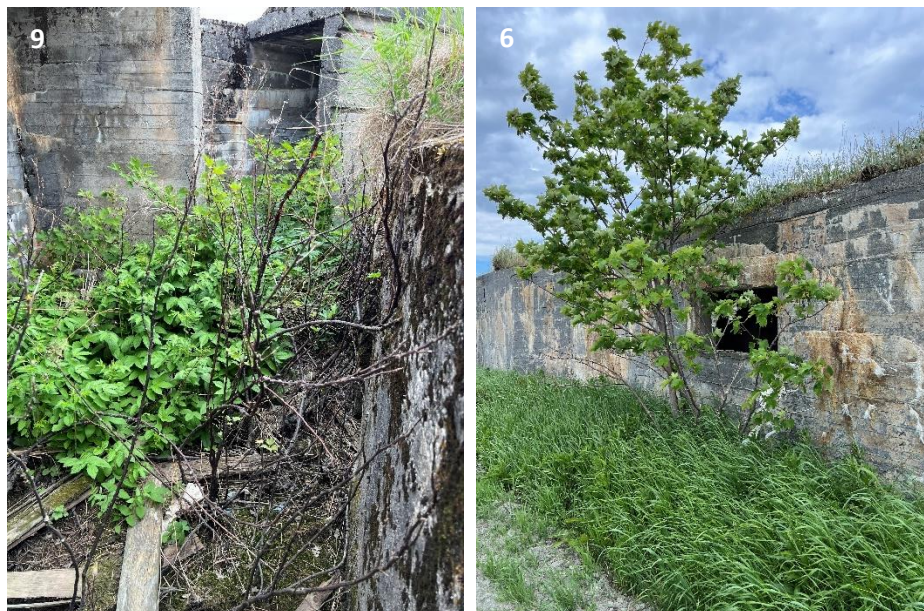
Figur 3-2. Fremmedarter. Nummerering refererer til plassering vist i Figur 3-1.