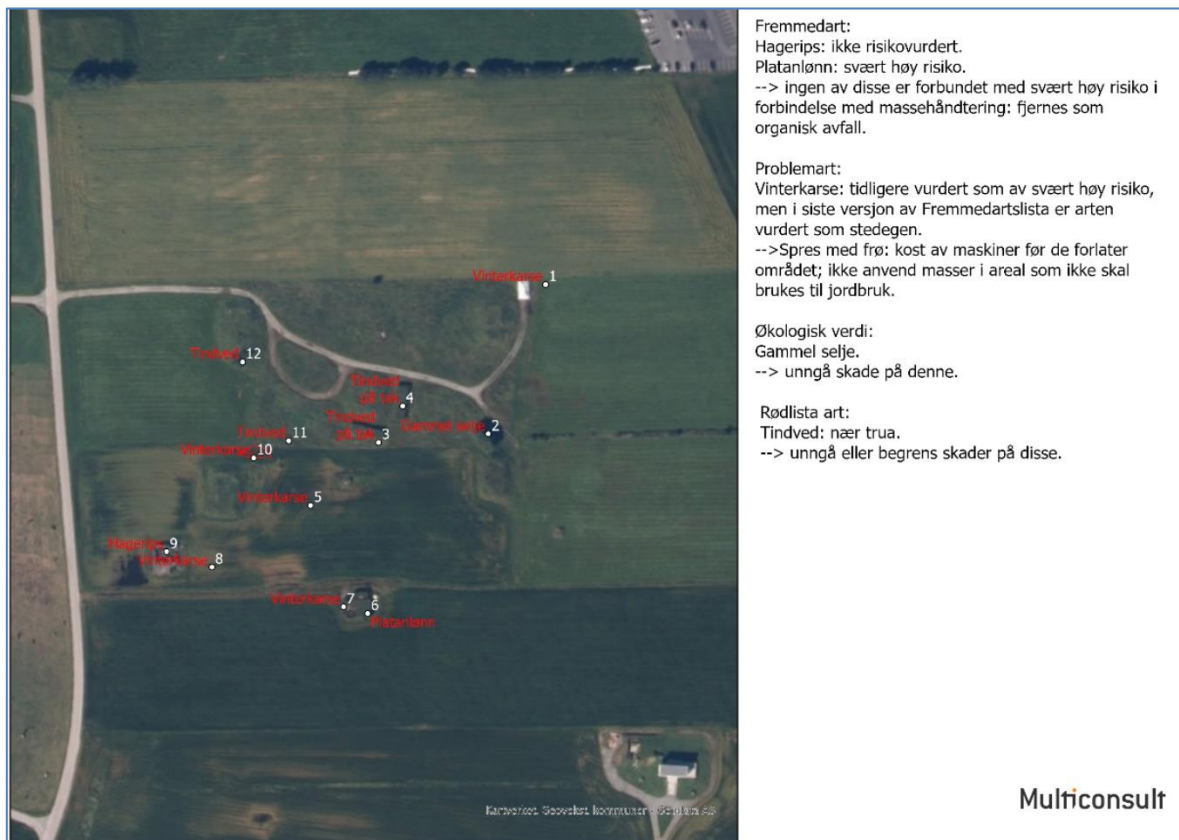
Figur 3-1. Observerte forekomster av fremmedarter, en problemart, et tre med økologisk verdi og en rødlista art.