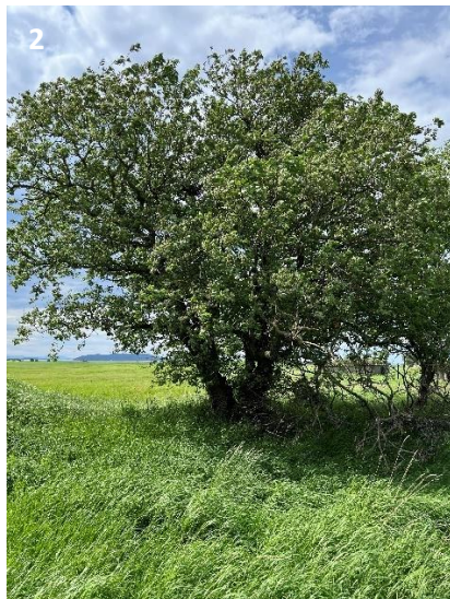
Figur 3-4. Tre av økologisk verdi. Nummerering refererer til plassering vist i Figur 3-1.