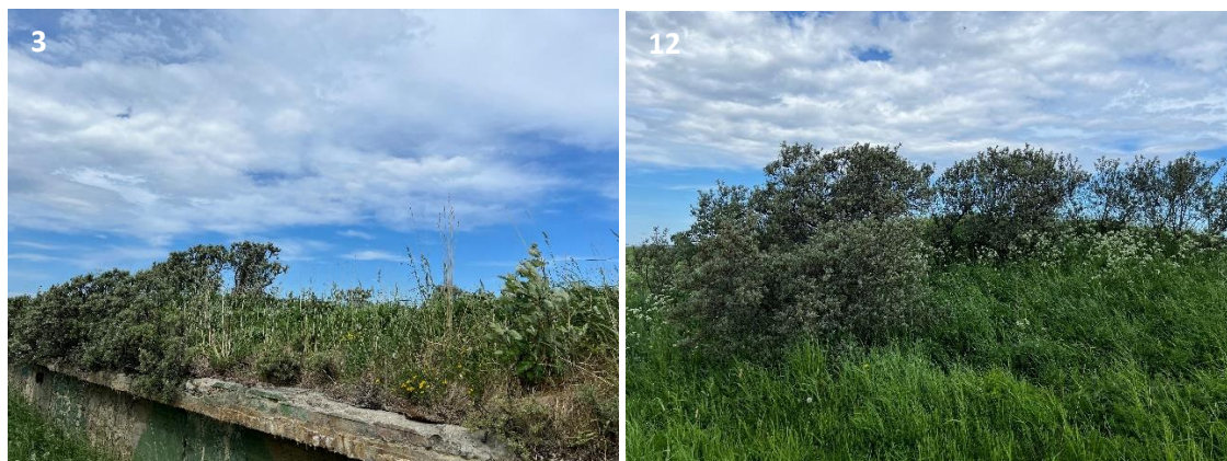
Figur 3-5. Rødlista art. Nummerering refererer til plassering vist i Figur 3-1.