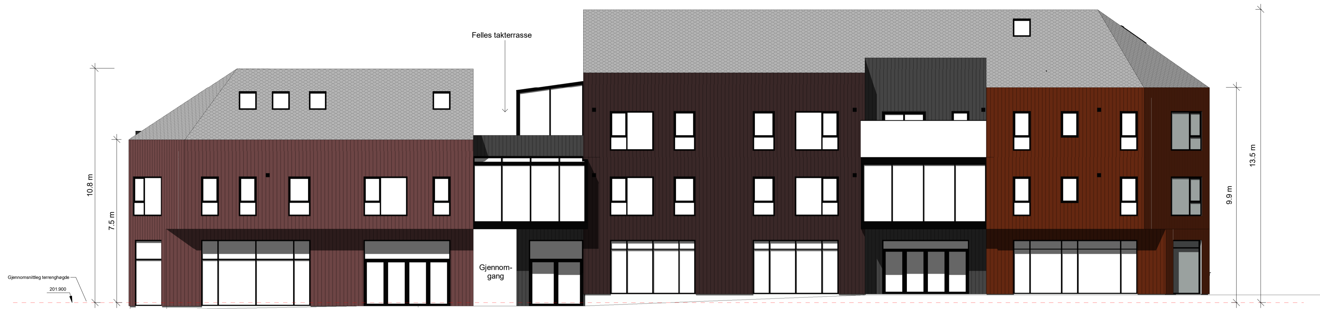
Fasade Aust 1 : 100