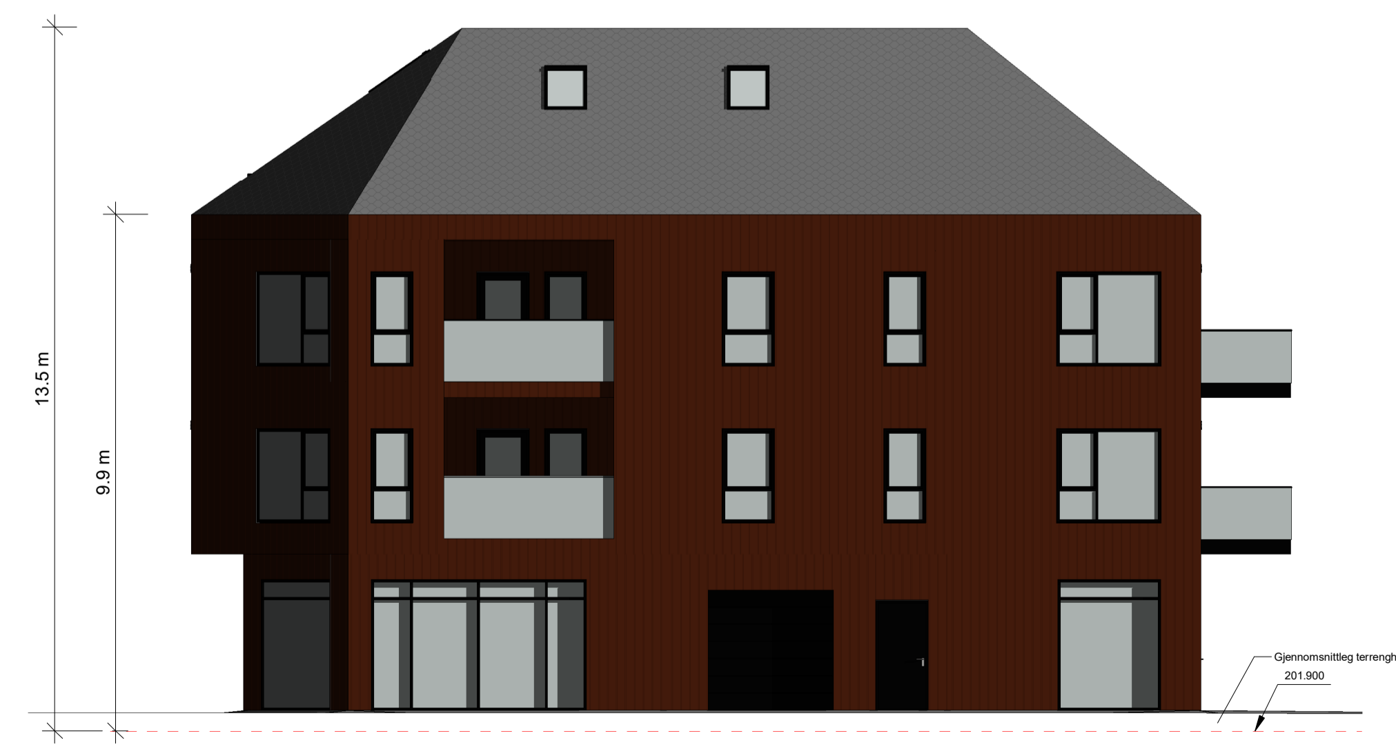
Fasade Nord 1 : 100