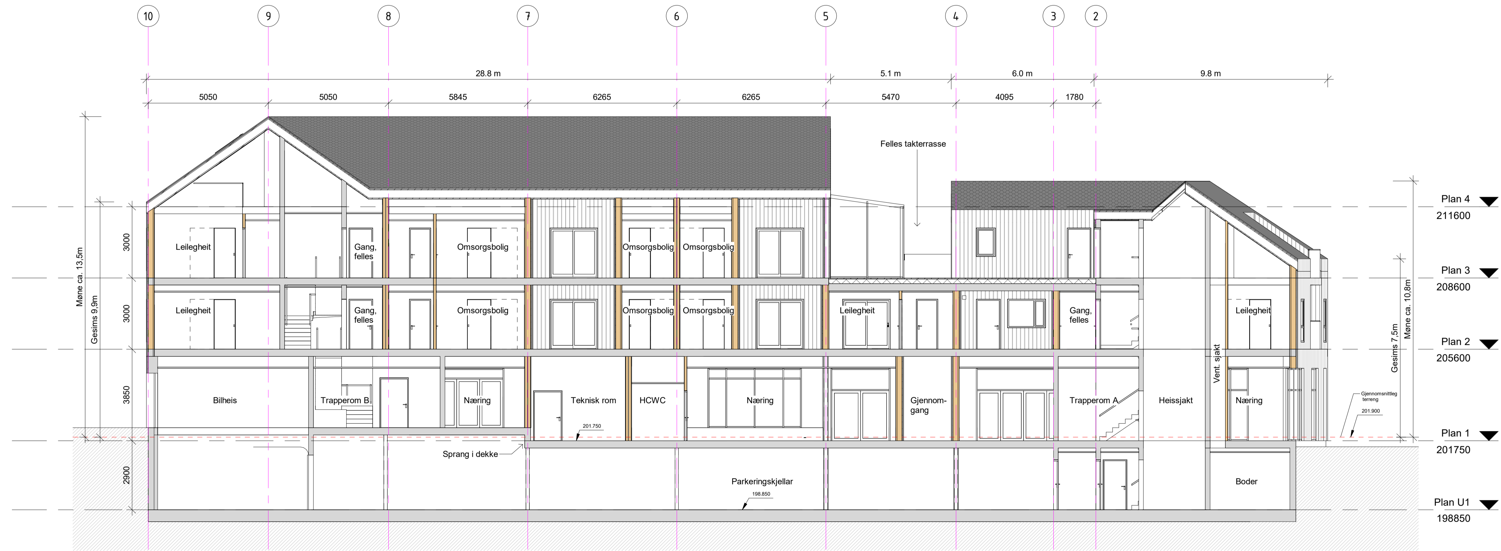
Snitt C-C 1 : 100