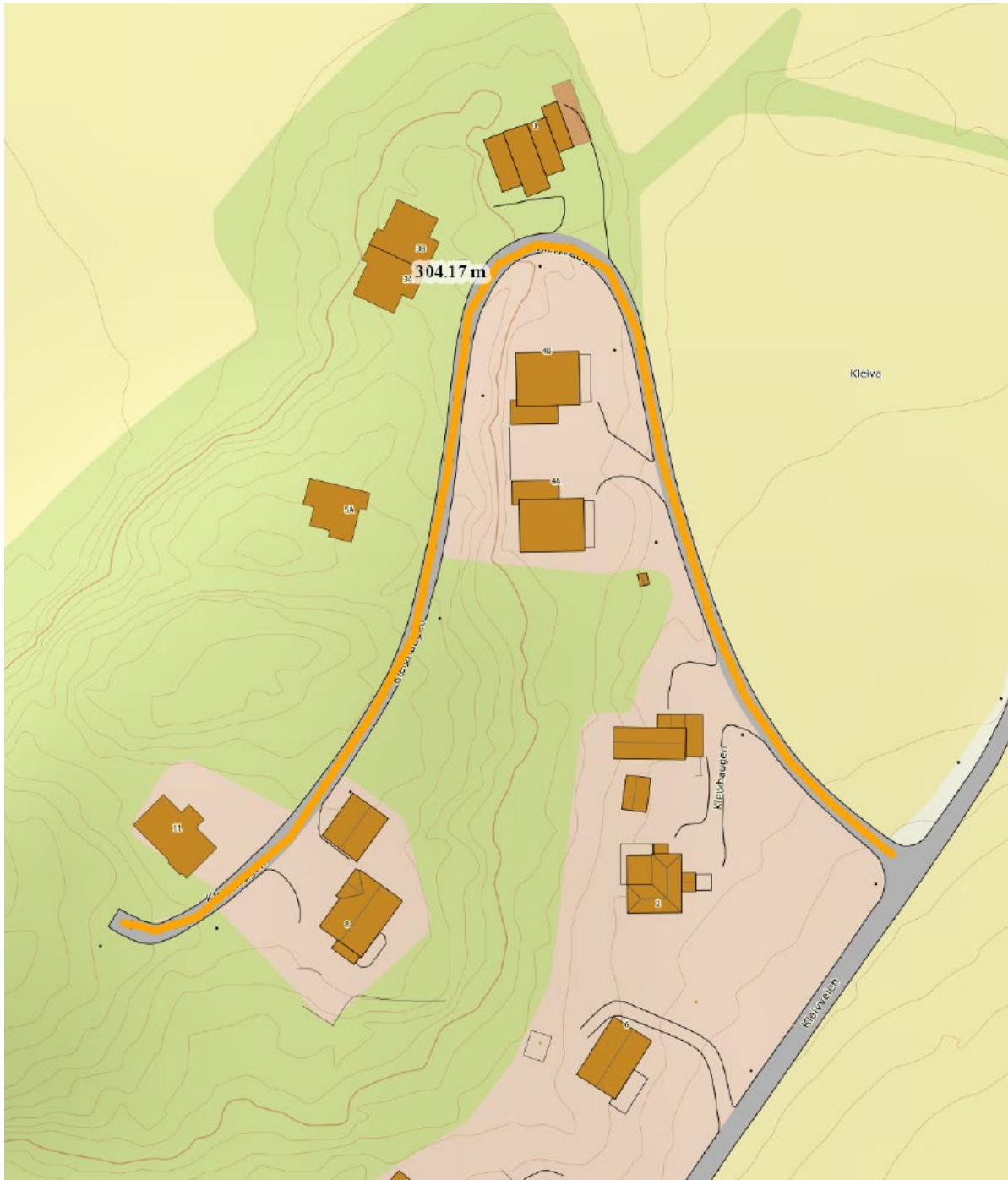
Bilde 1; Orange inje viser strekning som skal asfalteres på Kleivhaugen .