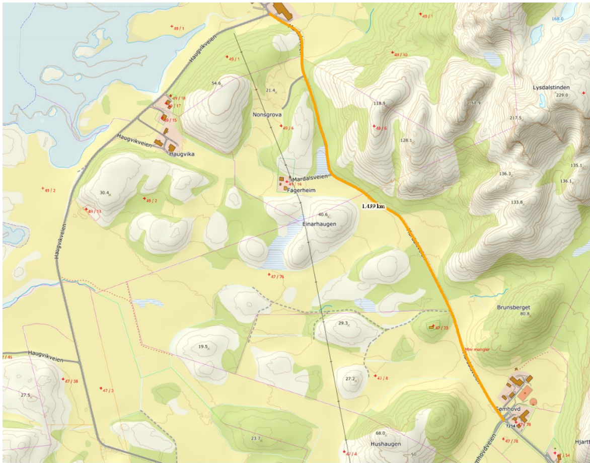
Bilde 1: Orange linje viser strekningen langs Mardalsveien som skal asfalteres- 1442 m