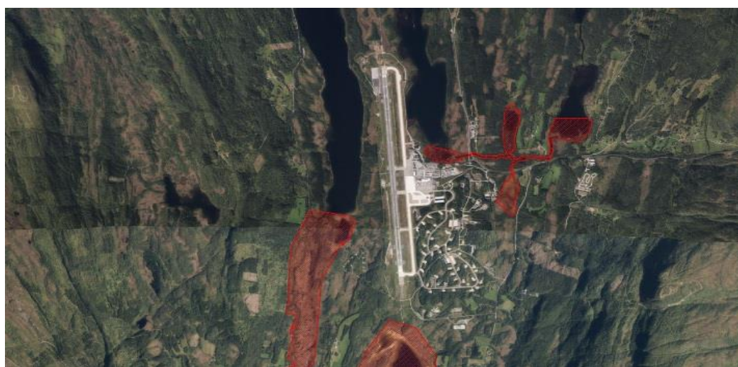
Figur 3: Flyfoto over Evenes lufthavn med de nærmeste naturreservatene Kjørvatn og Nautå naturreservat.