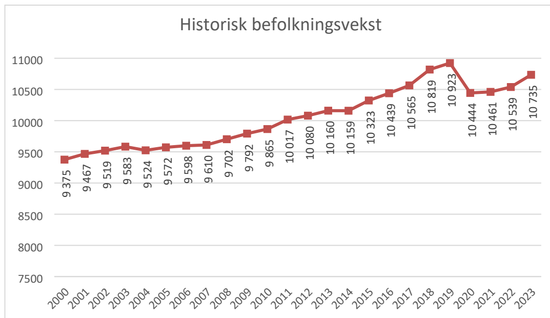
Figur 1 Befolkning per 1. januar i Midt-Telemark kommune (sammenslåtte tidsserier for Bø og Sauherad før 2020).

1.1.2023 var det 10 735 registrerte innbyggere i Midt-Telemark kommune. Veksten fra 2022 til 2023 er på nesten 200 personer. I tillegg til registrerte innbyggere, kommer ca. 2000 studenter ved USN Campus Bø.