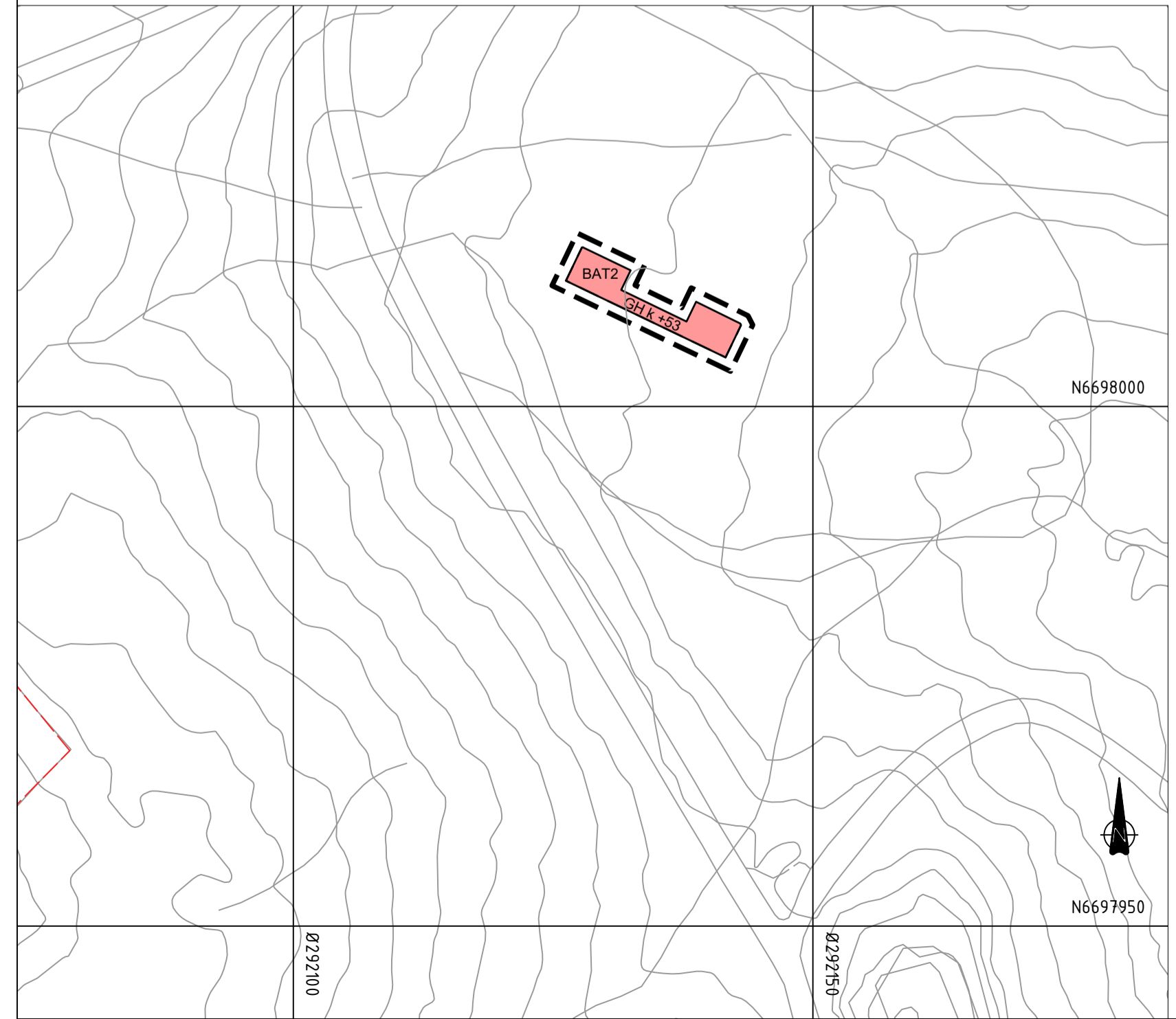
Regulering over grunnen, vertikalniva 3 M=1:500