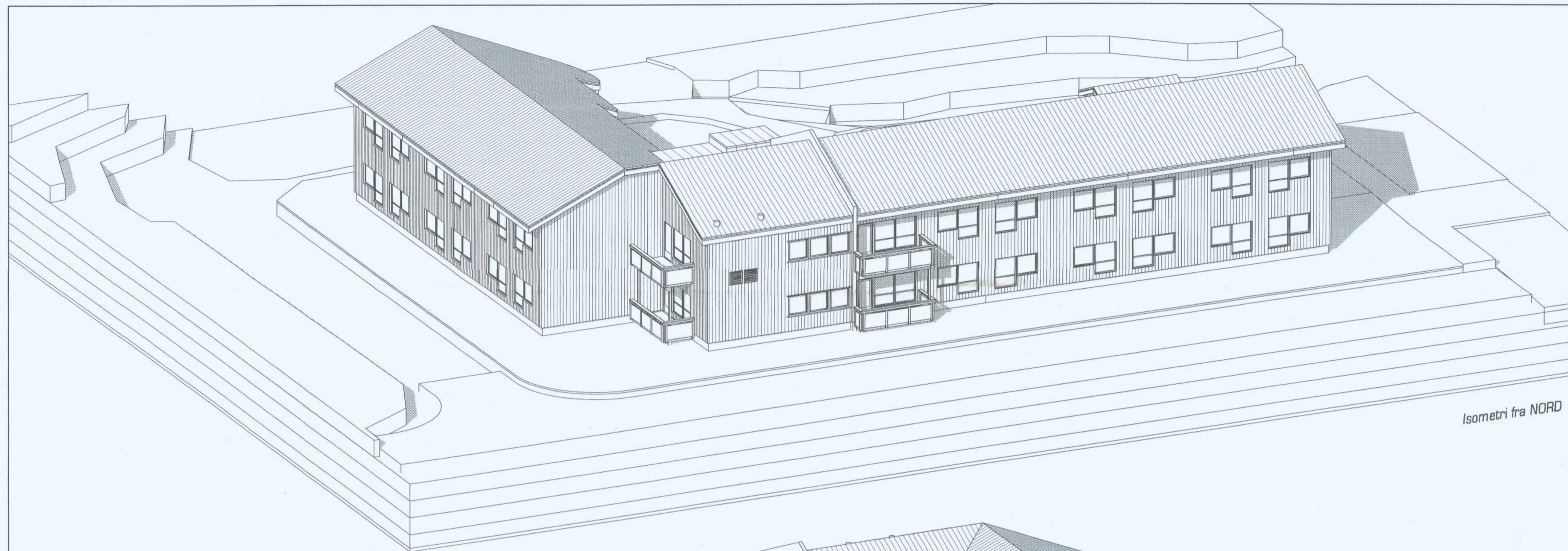
Isometri fra NORD