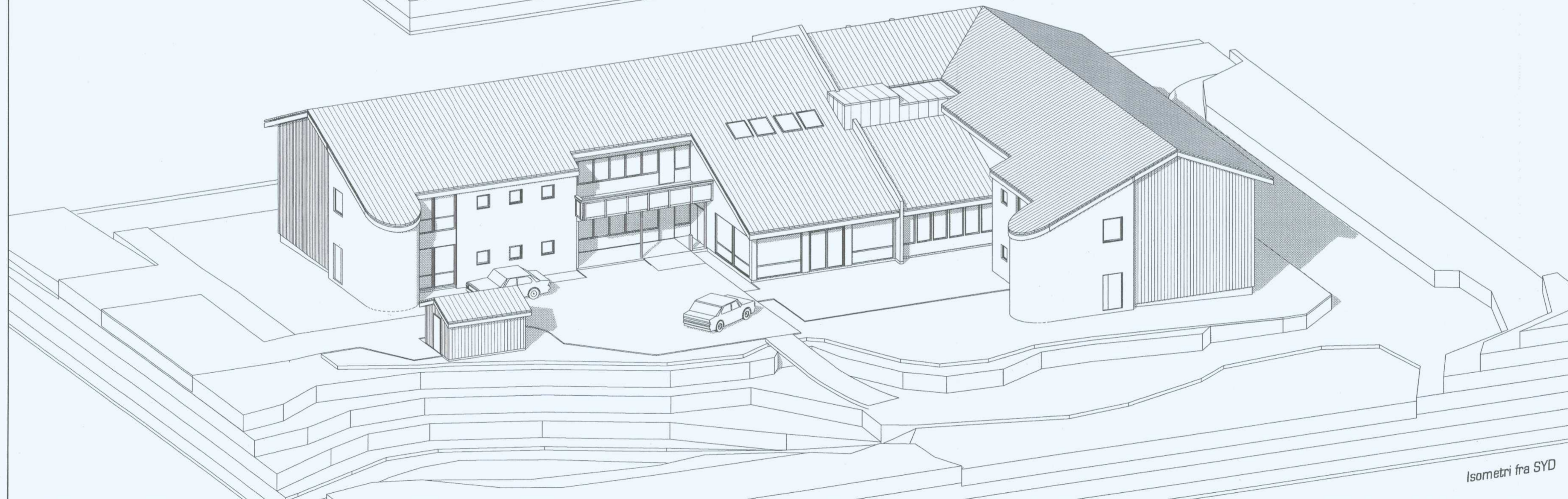
Isometri fra SYD

DEKLARASJONSVEDTAK 27.10.98 ARKITEKTKONTOR