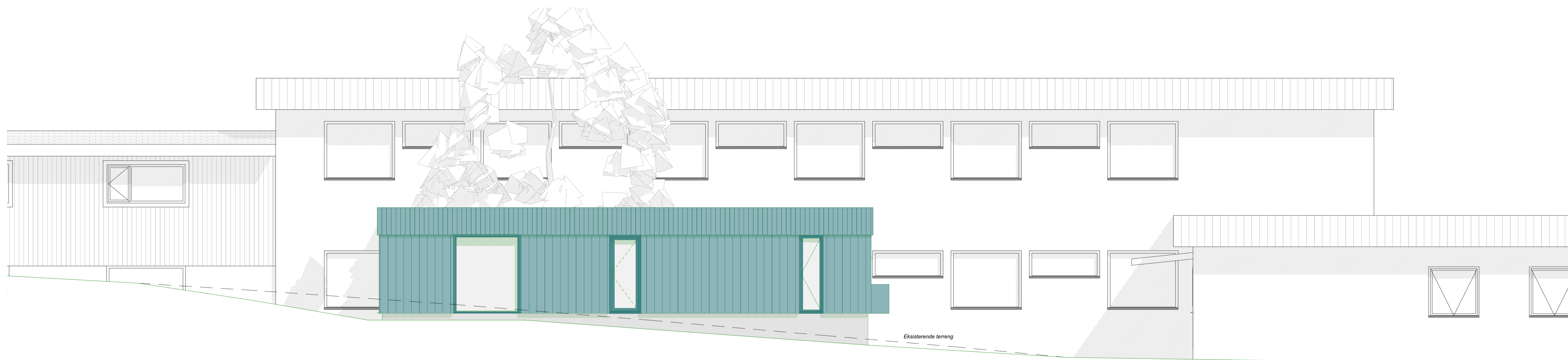
FASADE MOT NORD