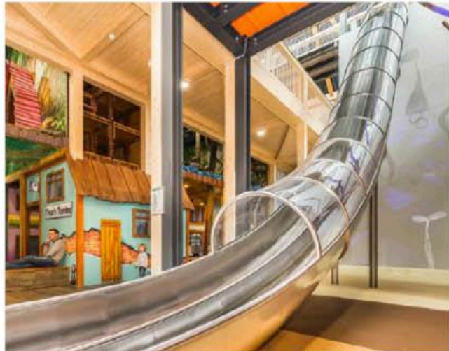
Eks. materialbruk på topp og bunn av sklie