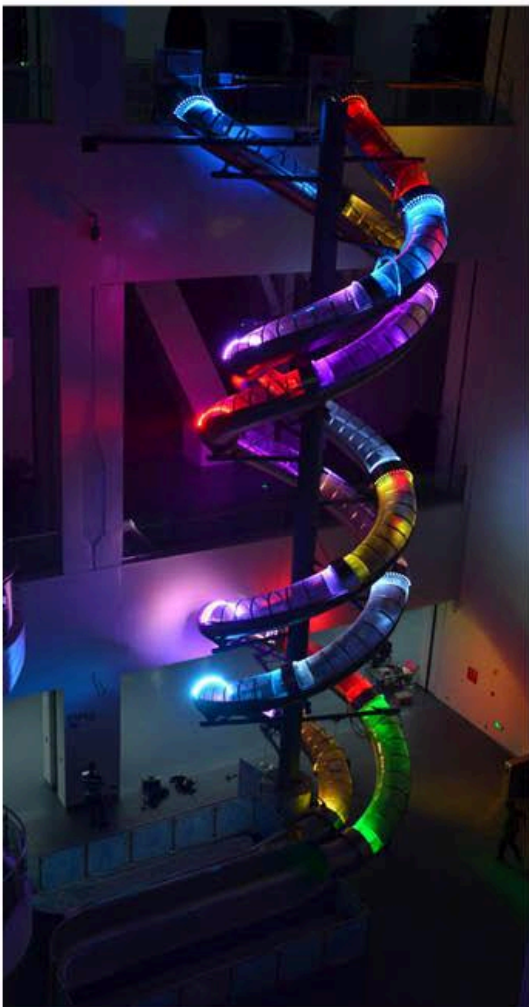
Eks. på belysning