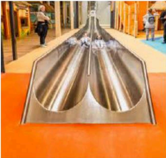
Eks. på tversnitt av dobbel sklie