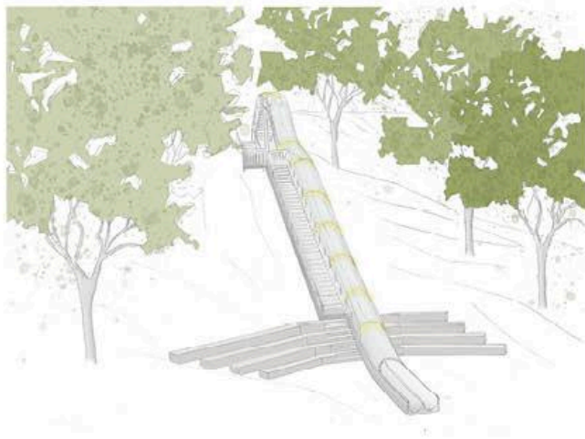
Skisse av sklien plassert i Hagabakken (illustrasjon av Larvik kommune)