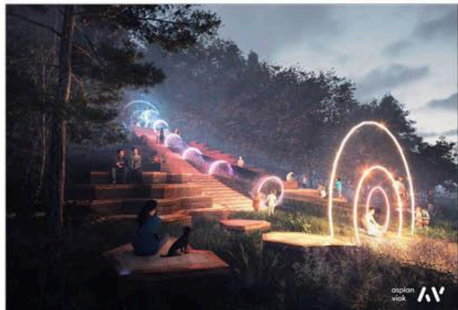
Stemmingsbilde fra skisseprosjekt for Hagadumpa 2023, bestilt av Larvik kommune (illustrasjon av Asplan Viak)