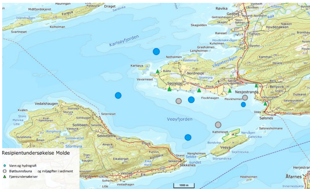
Figur 2: Veøyfjorden med foreslåtte prøvepunkt