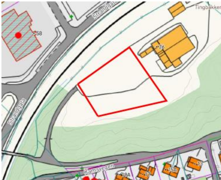
4155Kartutsnitt over riggområde

Byggherre stiller et område nord-øst for anleggsområdet til disposisjon til riggområde, se kartutsnitt under. Området skal settes i stand etter bruk til slik det var før oppstart. På område vil det være mulighet for tilknytning til strøm, vann og avløp. Det vises til anbudsbeifaringen for mer detaljert informasjon.