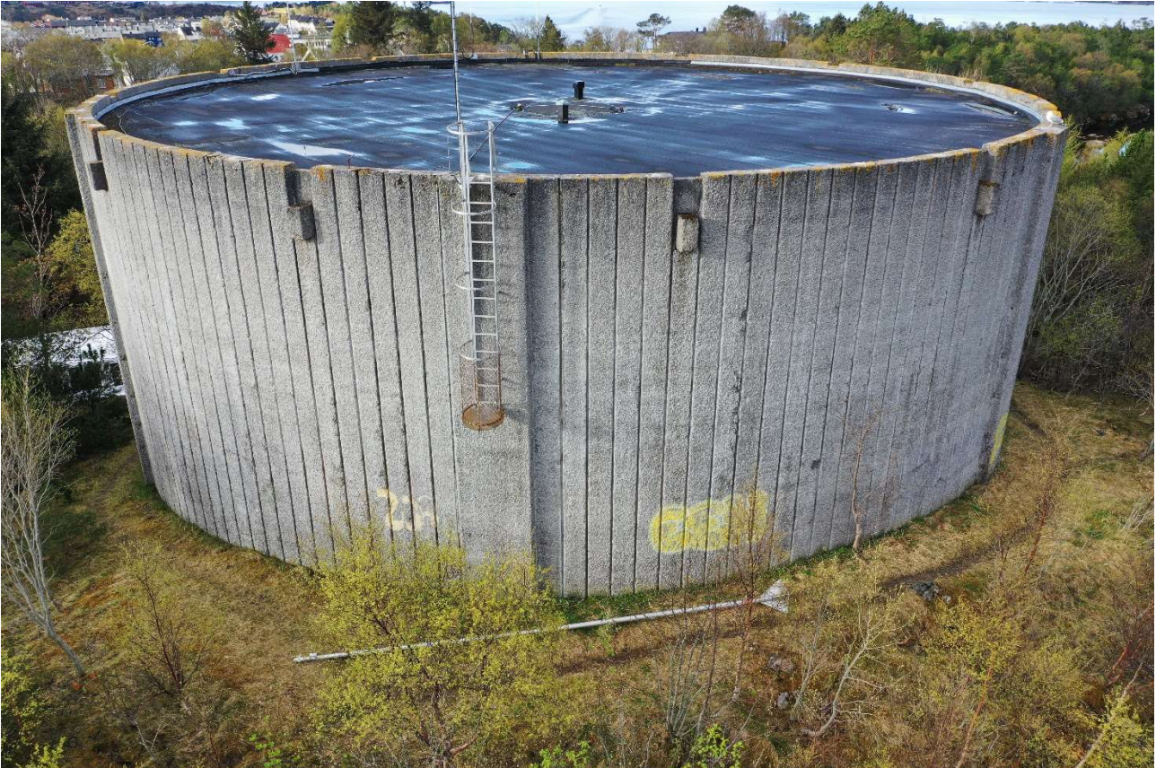
Bilde som viser eksisterende høydebasseng fra nordøst mot sørvest