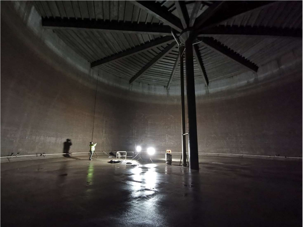
Høydebassenget sett fra innside som viser eksisterende betongkonstruksjon