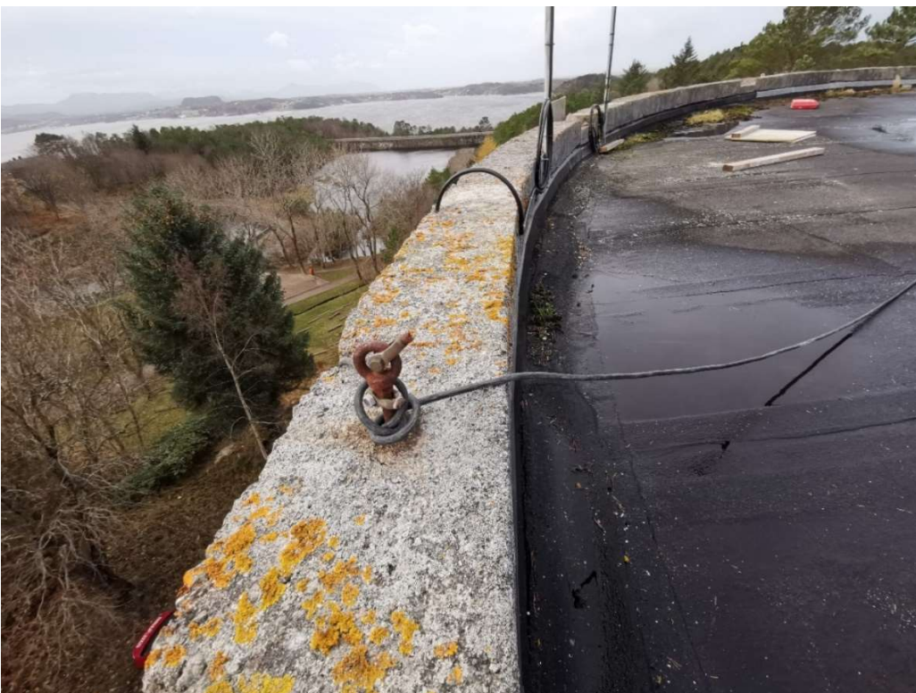
Bilder av eksponert gesimskant