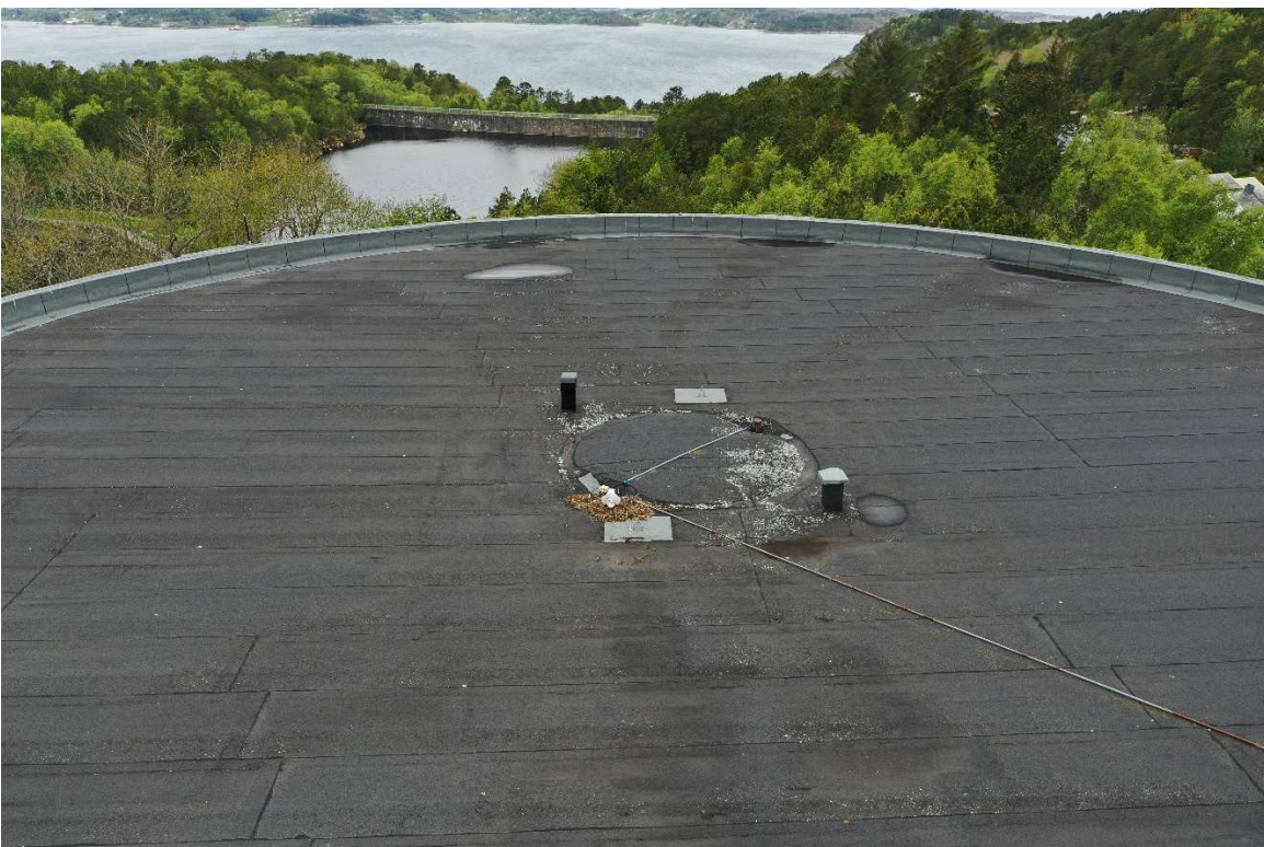
Bilder som viser eksisterende taktekking