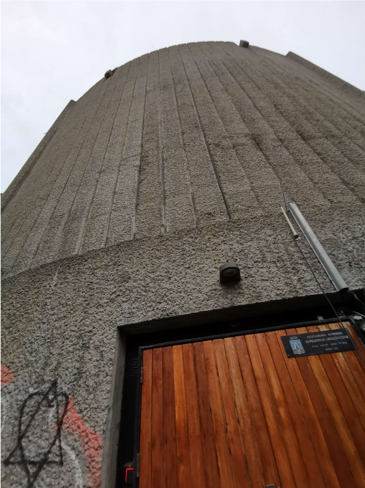
Bilde som viser betongstruktur i fasade og deler av inngangsdør til eksisterende ventilkommer