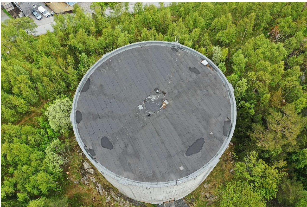
Eksisterende høydebasseng sett ovenfra

Høydebassenget i Vanndammen er lokalisert i «Vanndammen» i Kristiansund kommune. Norconsult bistår Kristiansund kommune v/ kommunalteknikk med vurderinger rundt rehabilitering av høydebassenget for drikkevann.