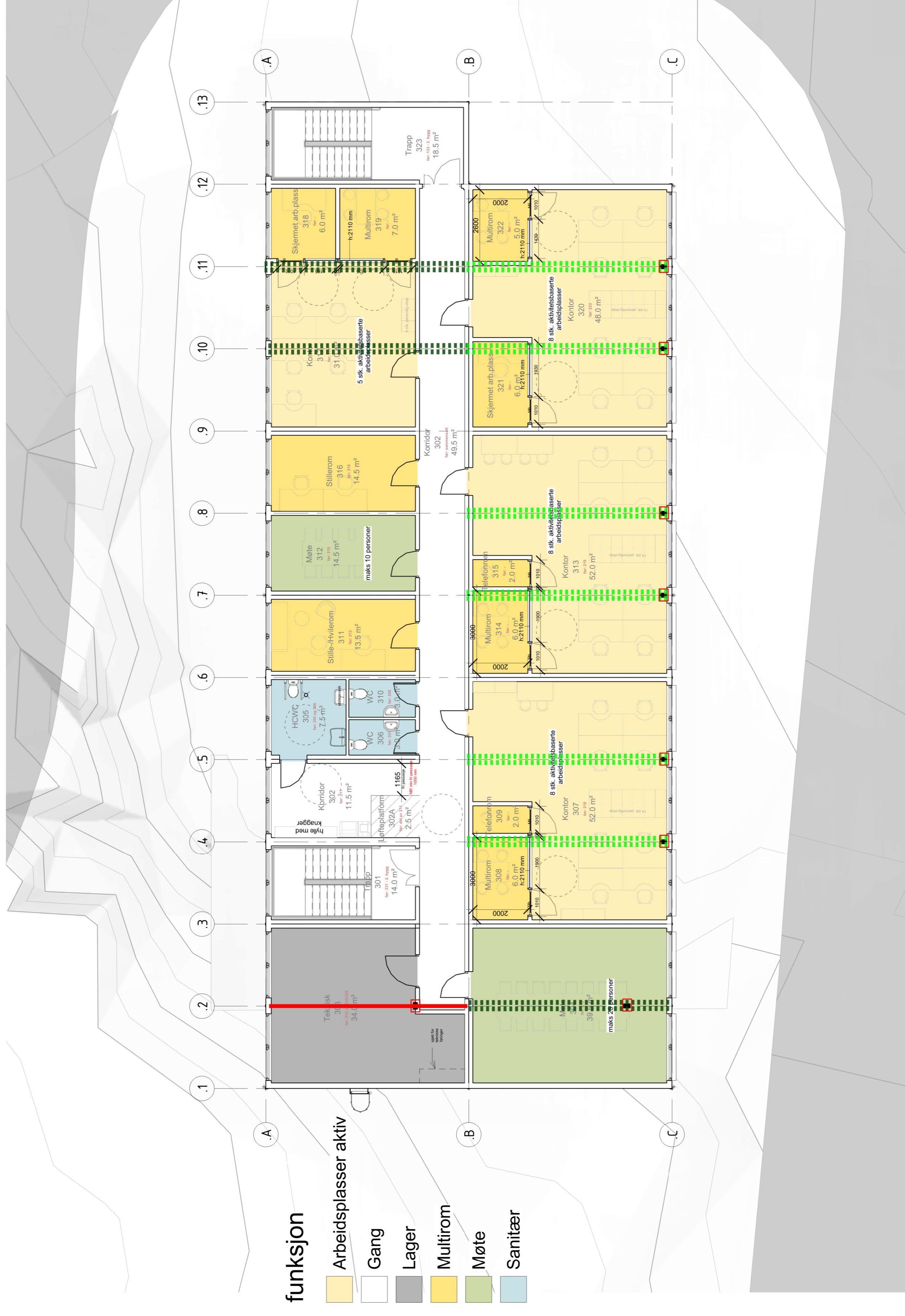
Modulbygg Plan 03 1 : 100