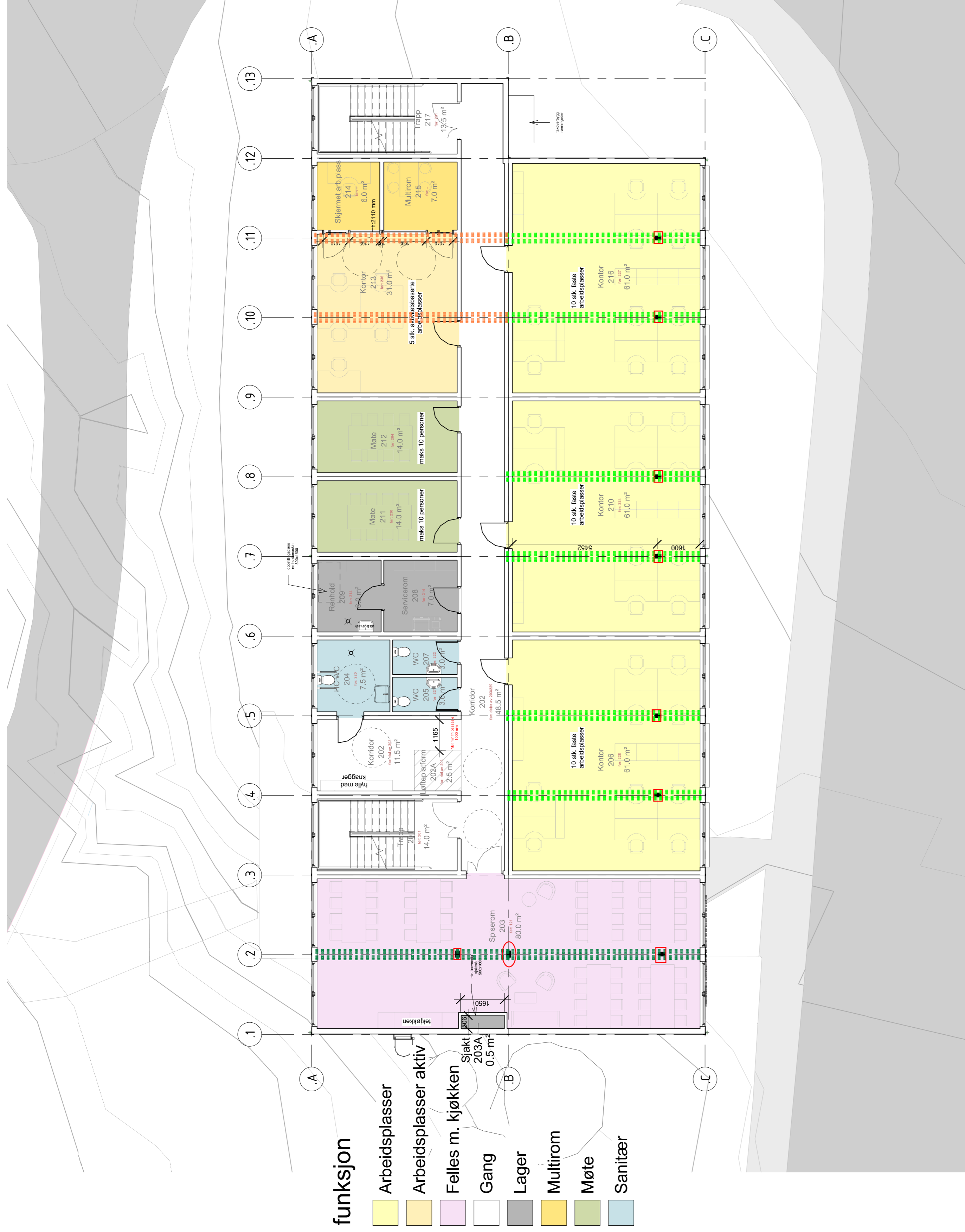
Modulbygg Plan 02 1 : 100