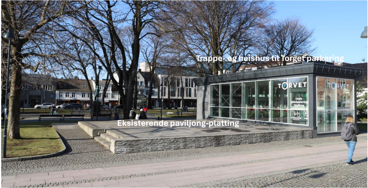
Trappe- og heishus til Torget-parkering