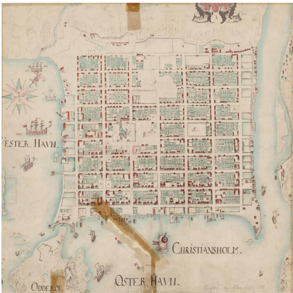
Kart over Kristiansand i 1764