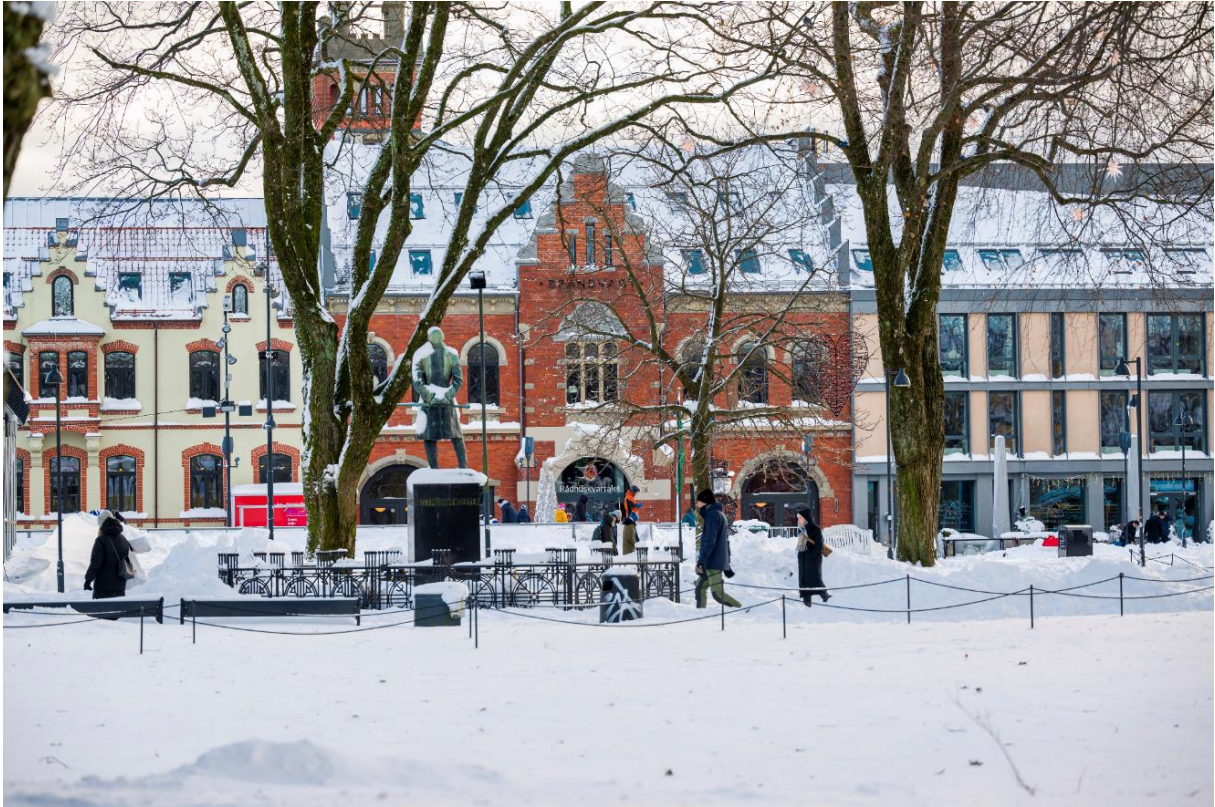
Wergelandsparken i vinterdrakt.