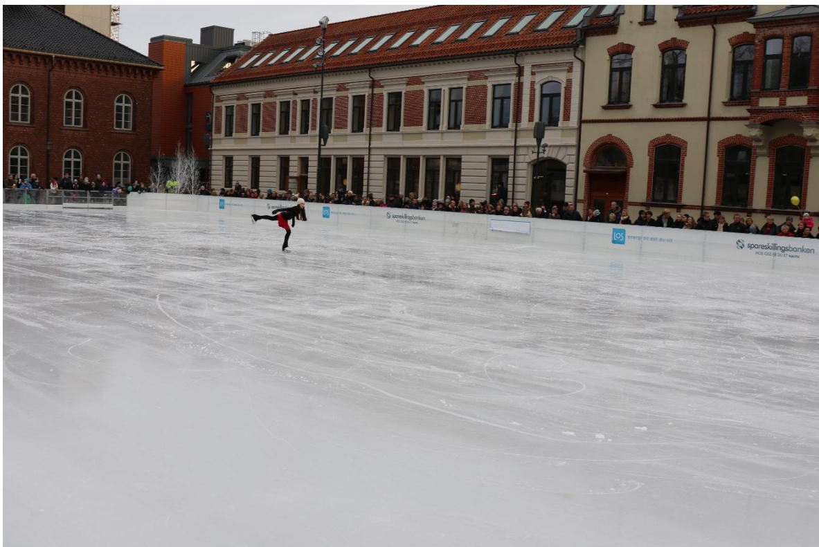
Åpning av Julebyen og isbanen.

Nedre torv er prioritert for torvhandel, mens øvre Torv er prioritert for arrangementsareal.