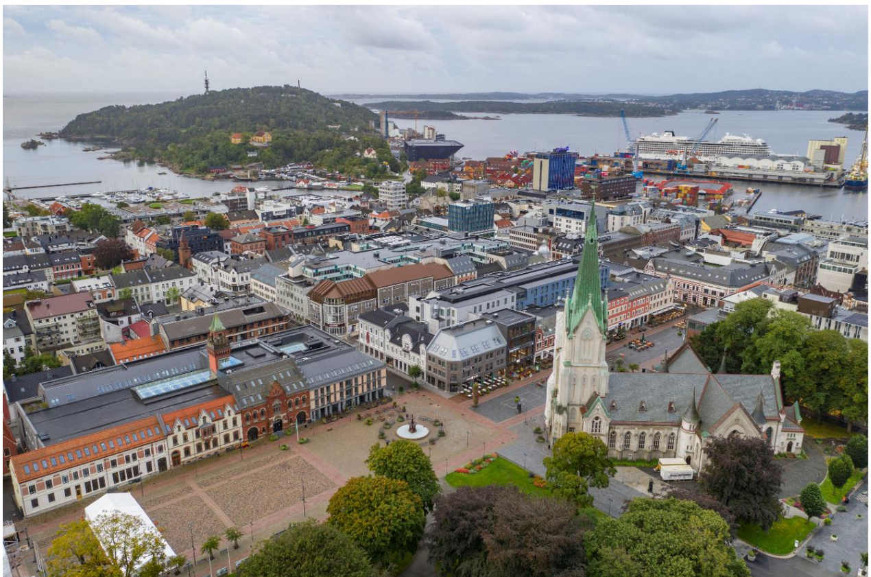
Dronebilde fra torvet.

Etter vedtak om ny parkeringskjeller under Torvet, ble det mulighet for å restaurere og videreutvikle torvgulvet både historisk, estetisk og bruksmessig som byens storstue og møteplass. Fontener på sommeren og isbane om vinteren er blant de nye attraksjonene. Det ble arrangert en stor åpningsfest for det nye Torvet 16.08.2018.