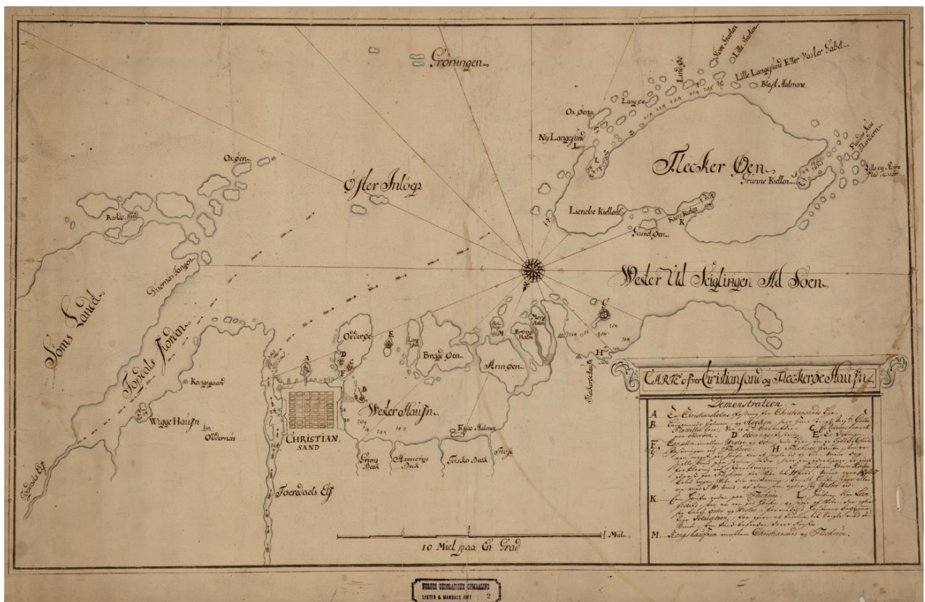
Lister og Mandals amr nr 2: Carte over Christiansand og Flecherør Haufn (Historiske kart, Kartverket)

Befaling om grunnleggelse av Kristiansand by ble undertegnet av kong Christian den 4. den 5.juli i 1641.