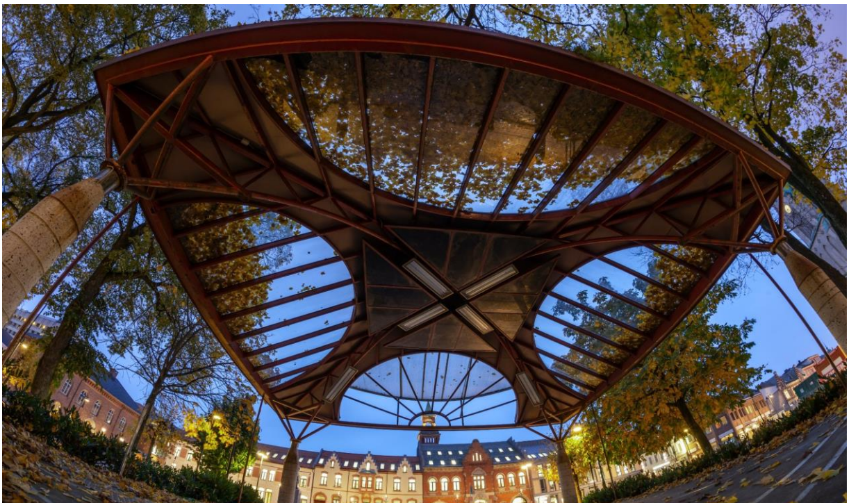
Tidligere paviljong v/ arkitekt Nils Svensson.

Det er utarbeidet en mulighetsstudie av MMW Arkitekter AS for prosjektet om ny paviljong, da med tema temporære installasjoner. For å sikre like konkurransevilkår, er mulighetsstudien vedlagt konkurransegrunnlaget som vedlegg 2. Det presiseres i den forbindelse at oppdragsgiver ikke anser at MMW Arkitekter AS har noen konkurransefordel som forhindrer dem fra å delta i konkurransen på normalt vis.