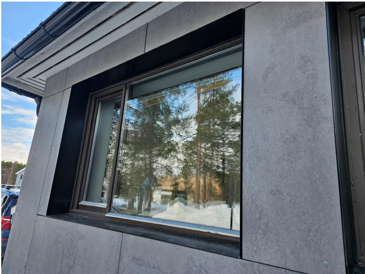
Bilde 8.1, viser utvendig beslag/ foring av «gamle» vinduer, kaserne «Rygge»