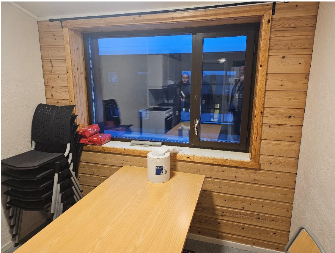
Bilde 7.2, viser forlegningsrom.