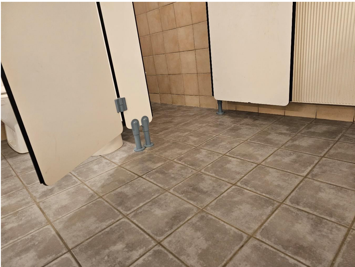
Bilde 6.5, viser toalett «Dame» i kjeller.