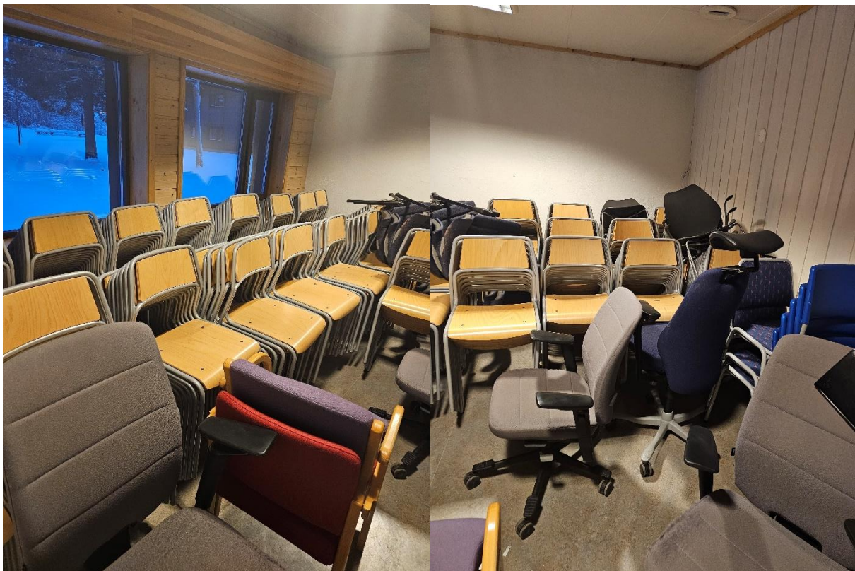
Bilde 5.7-5.8, viser «lager» ønsket til nytt kjøkken