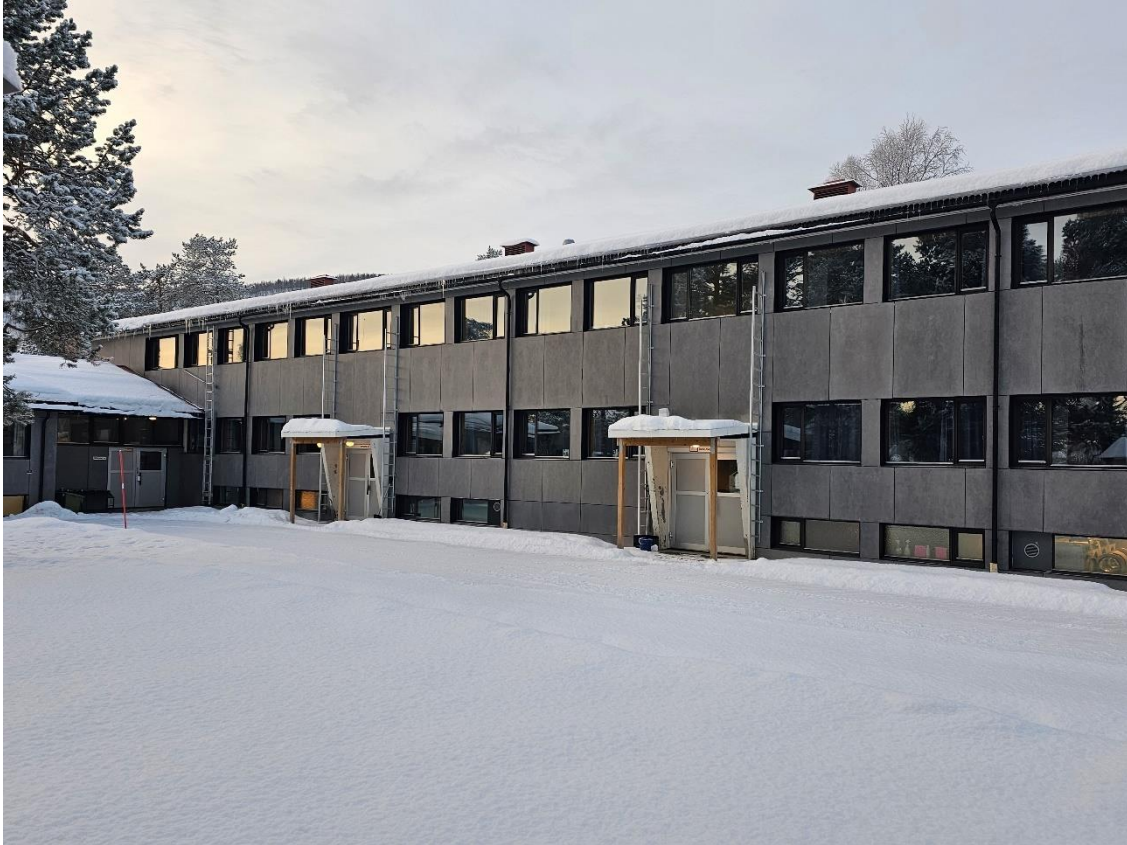
Bilde 1, viser fasaden mot øst