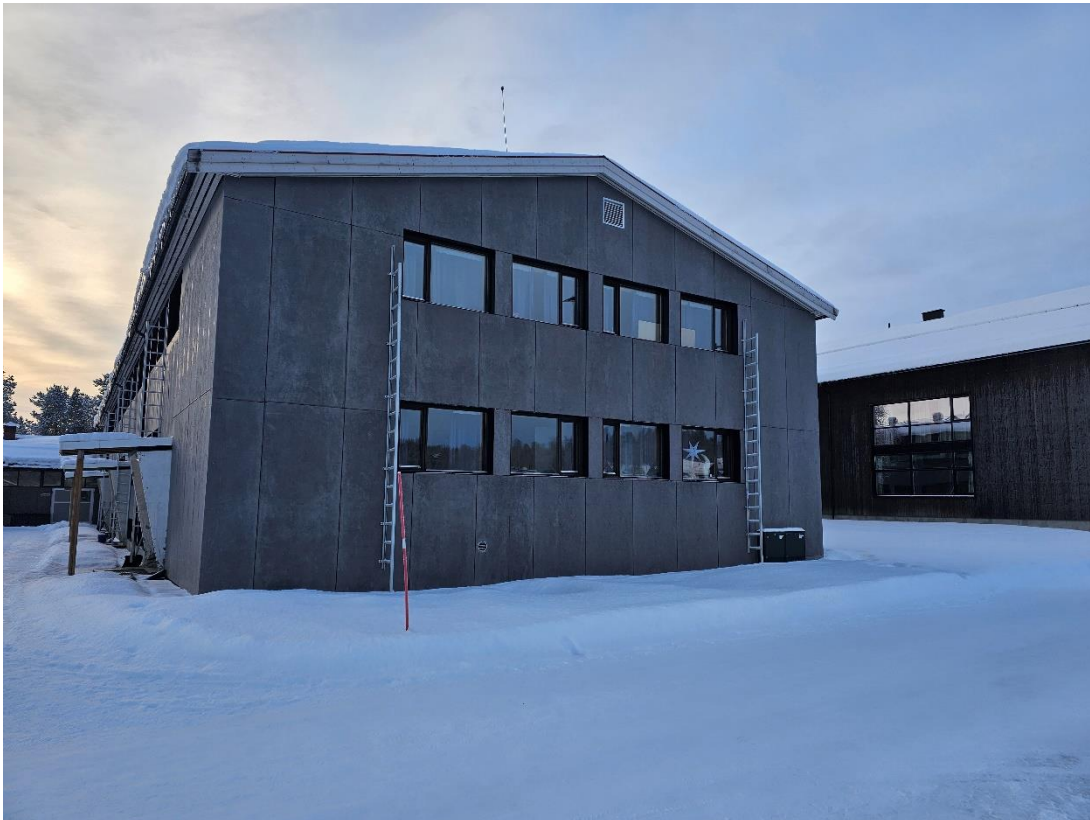
Bilde 4, viser fasade mot nord