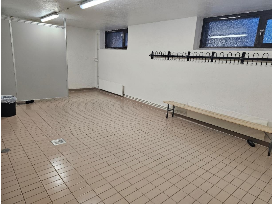
Bilde 5.1, viser garderobe «Herre» i kjeller.