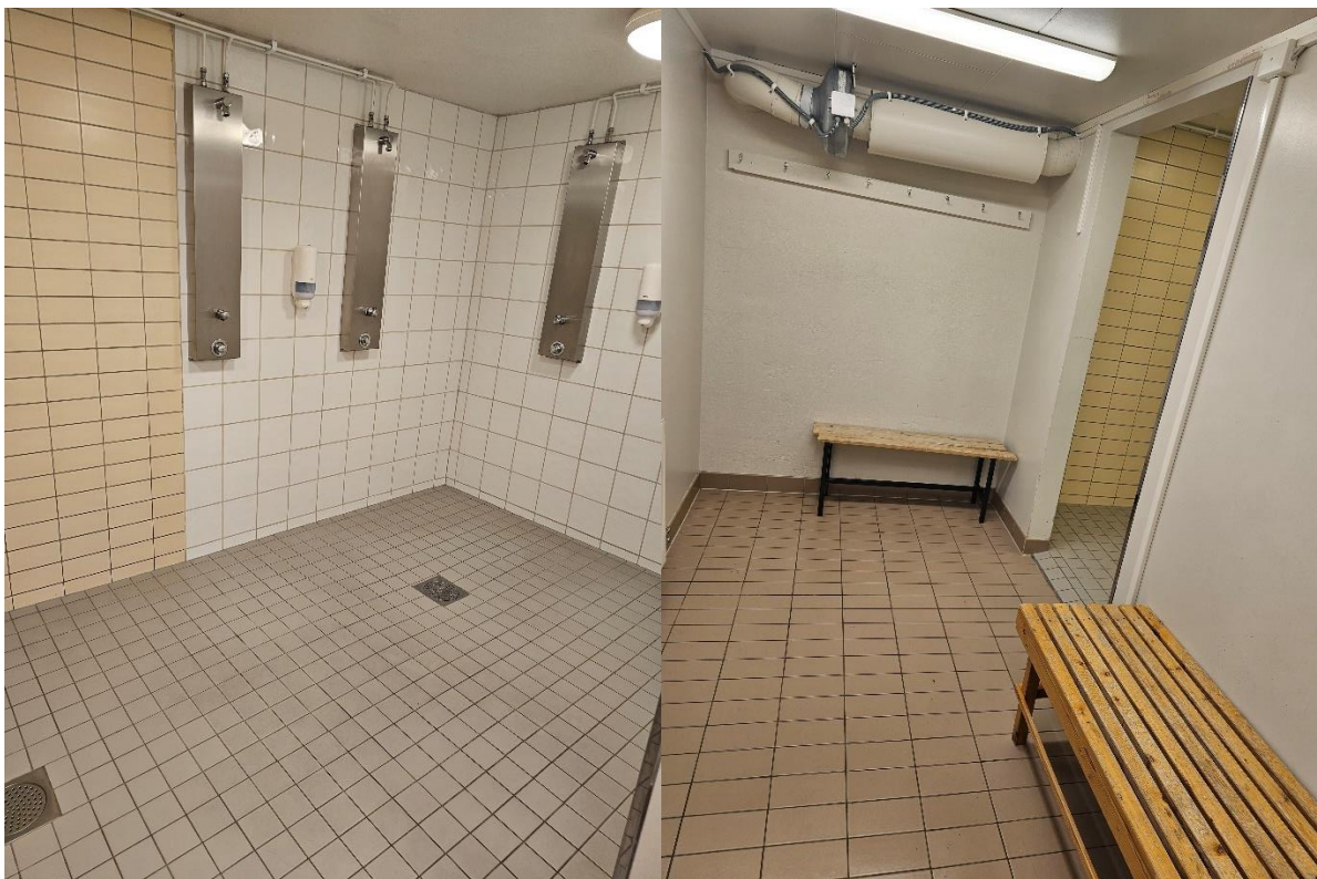
Bilde 5.4-5.5, viser damegarderobe m/ dusj