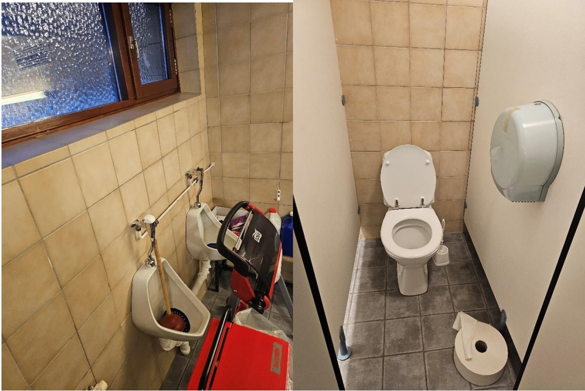
Bilde 6.3-6.4, viser toalett «Dame» i kjeller.