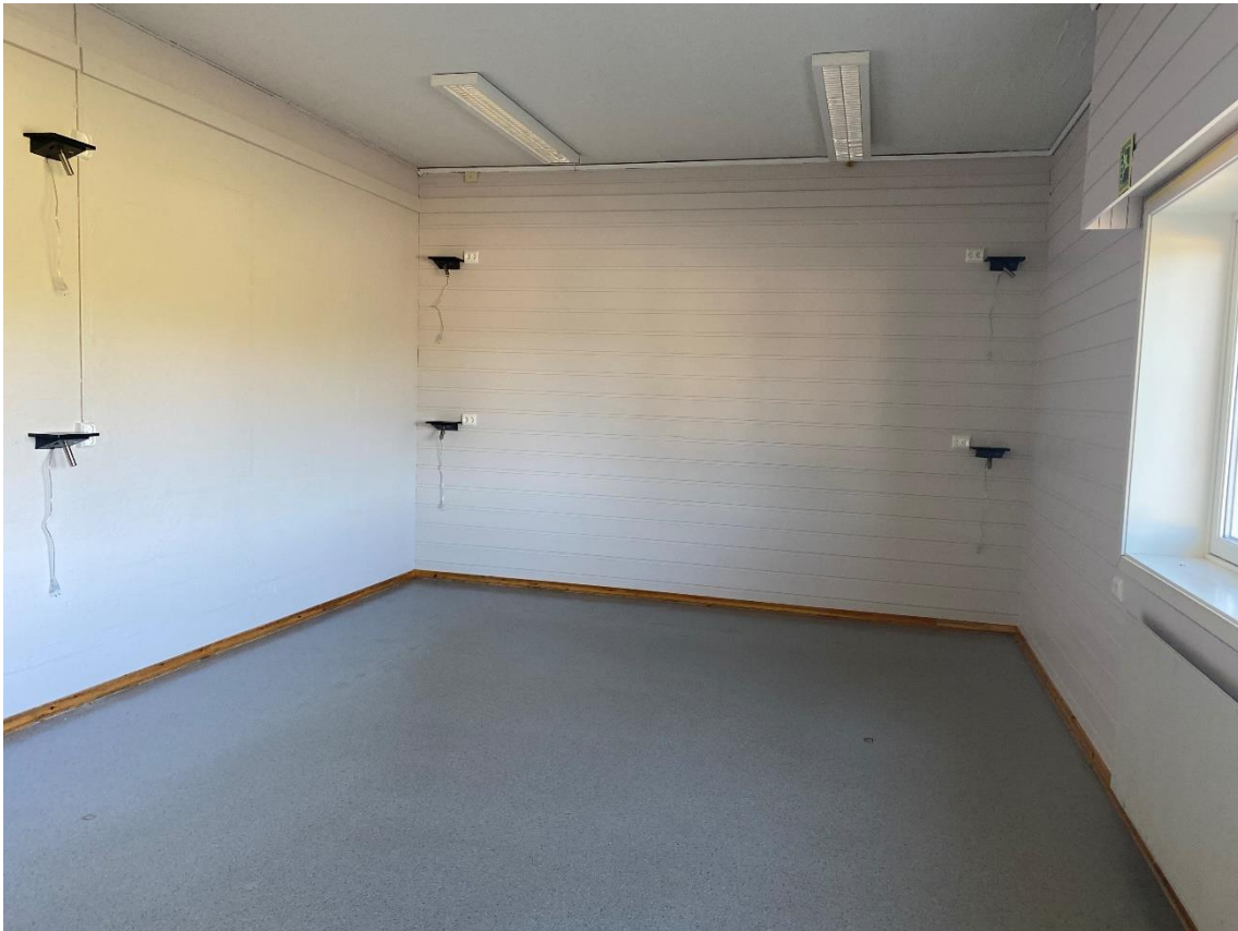
Bilde 7.4, viser referanserom, sluttresultat «Jørstadmoen»