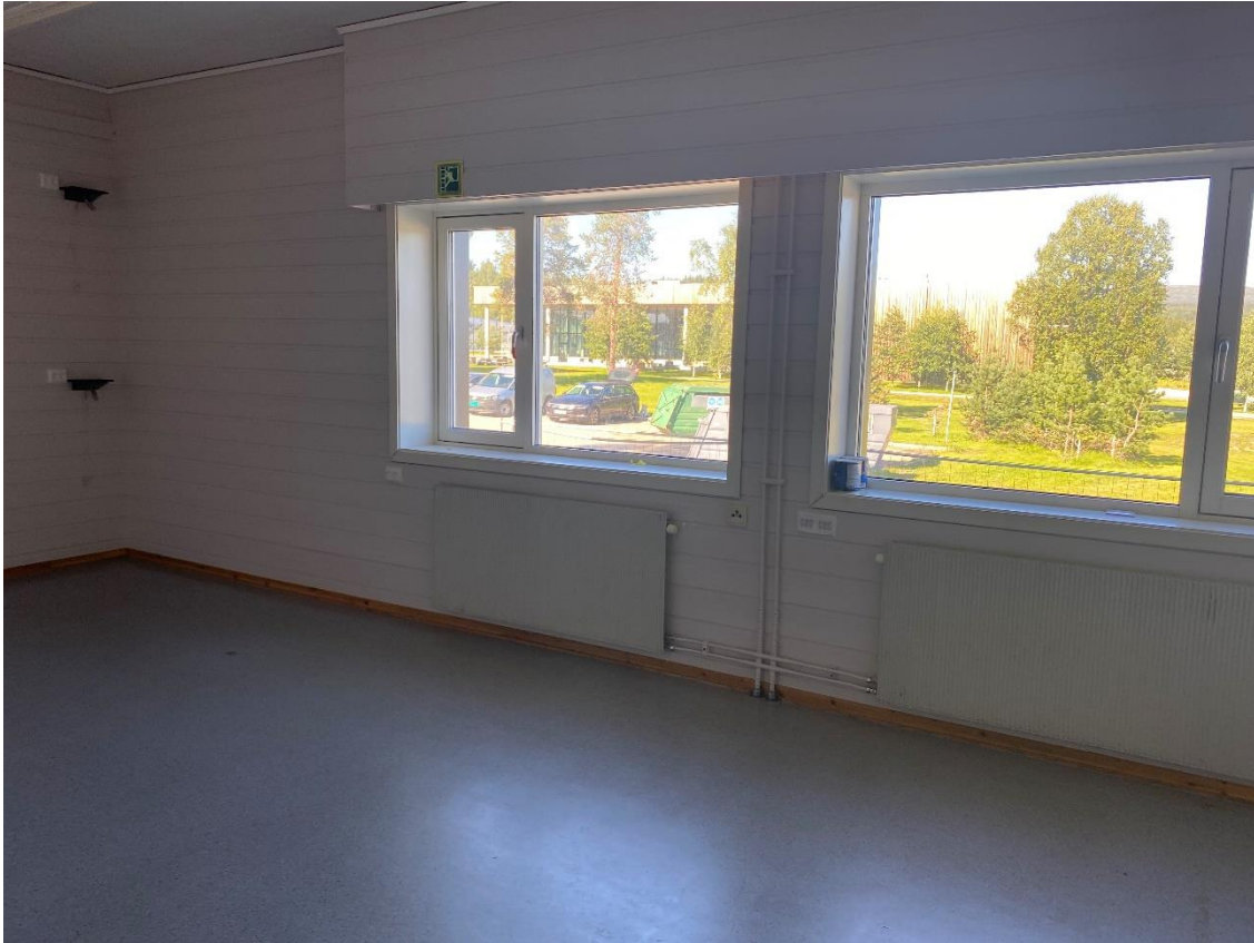
Bilde 7.3, viser referanserom, sluttresultat «Jørstadmoen»