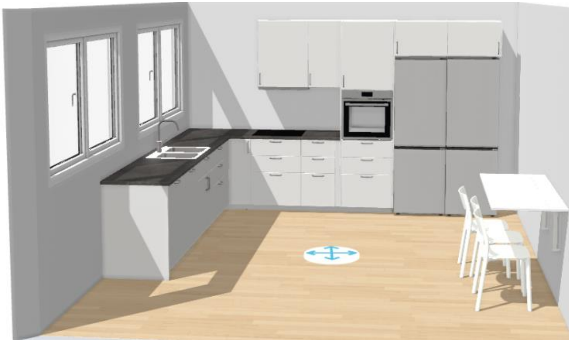
Bilde 7.5, viser forslag løsning på kjøkken. NB! Bare til farge, og løsning.