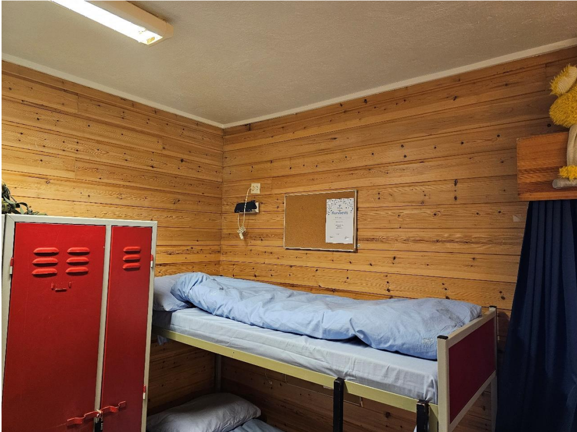
Bilde 7.1, viser forlegningsrom.