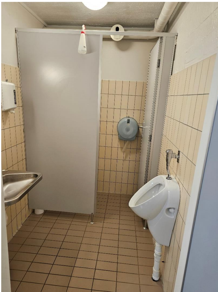
Bilde 5.2, viser toalett i garderobe «Herre» i kjeller.