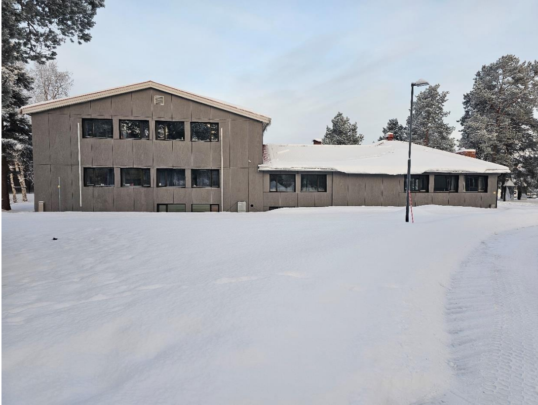
Bilde 2, viser korridor fasade mot sør