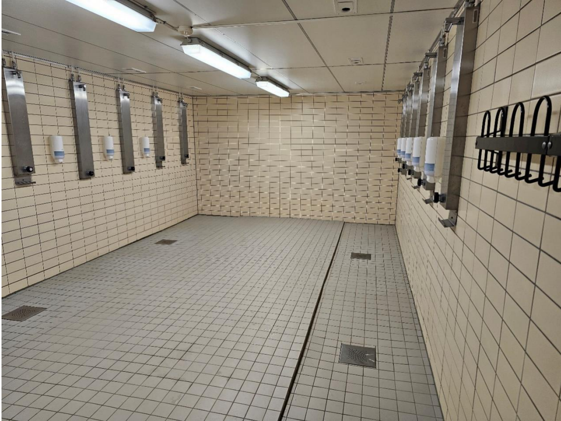
Bilde 5.3, viser dusj i garderobe «Herre» i kjeller