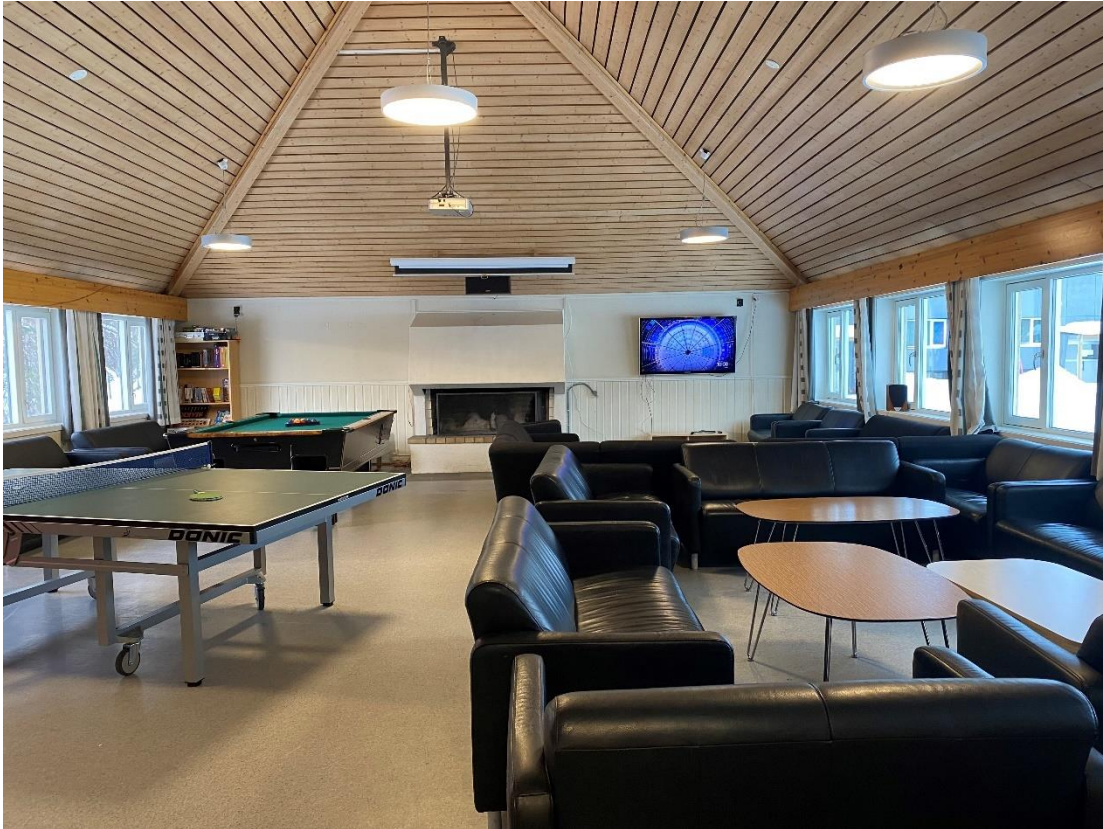
Bilde 5.6, viser TV-stue