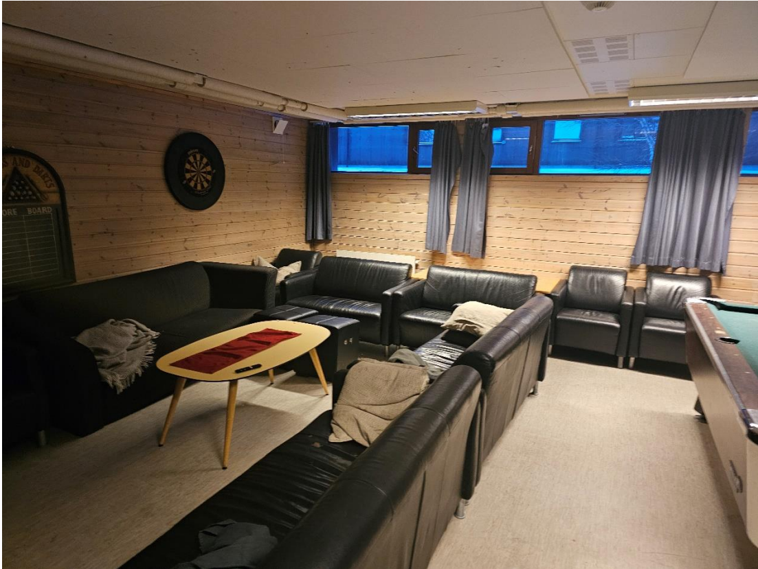
Bilde 5.9, viser kjellerstue