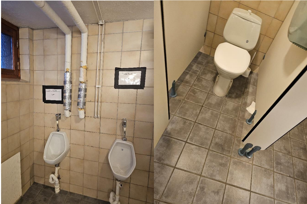
Bilde 6.1, viser toalett «Herrer» i kjeller

Bilde 5.12, viser referanserom fra kaserne «Jørstadmoen» ferdig renoveret.