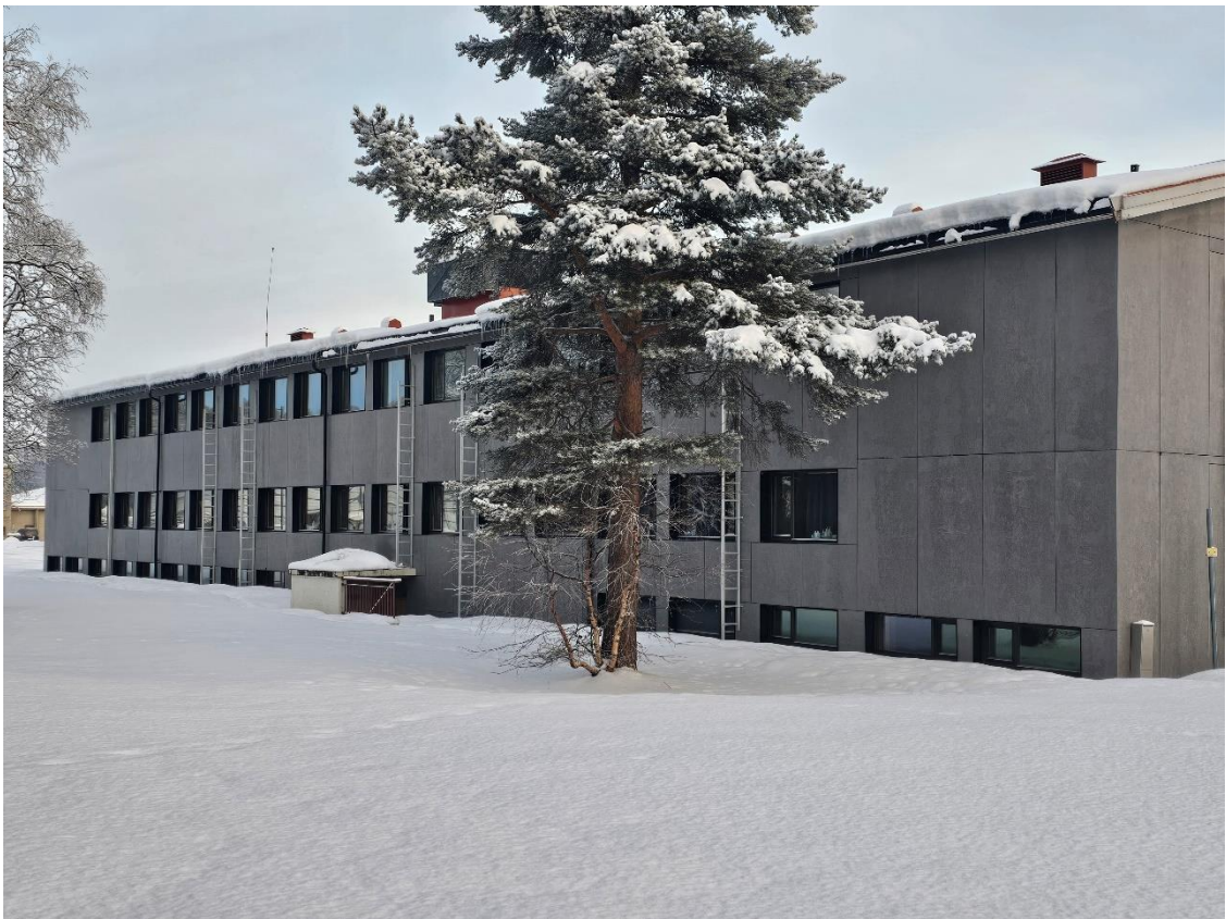
Bilde 3, viser fasade mot vest