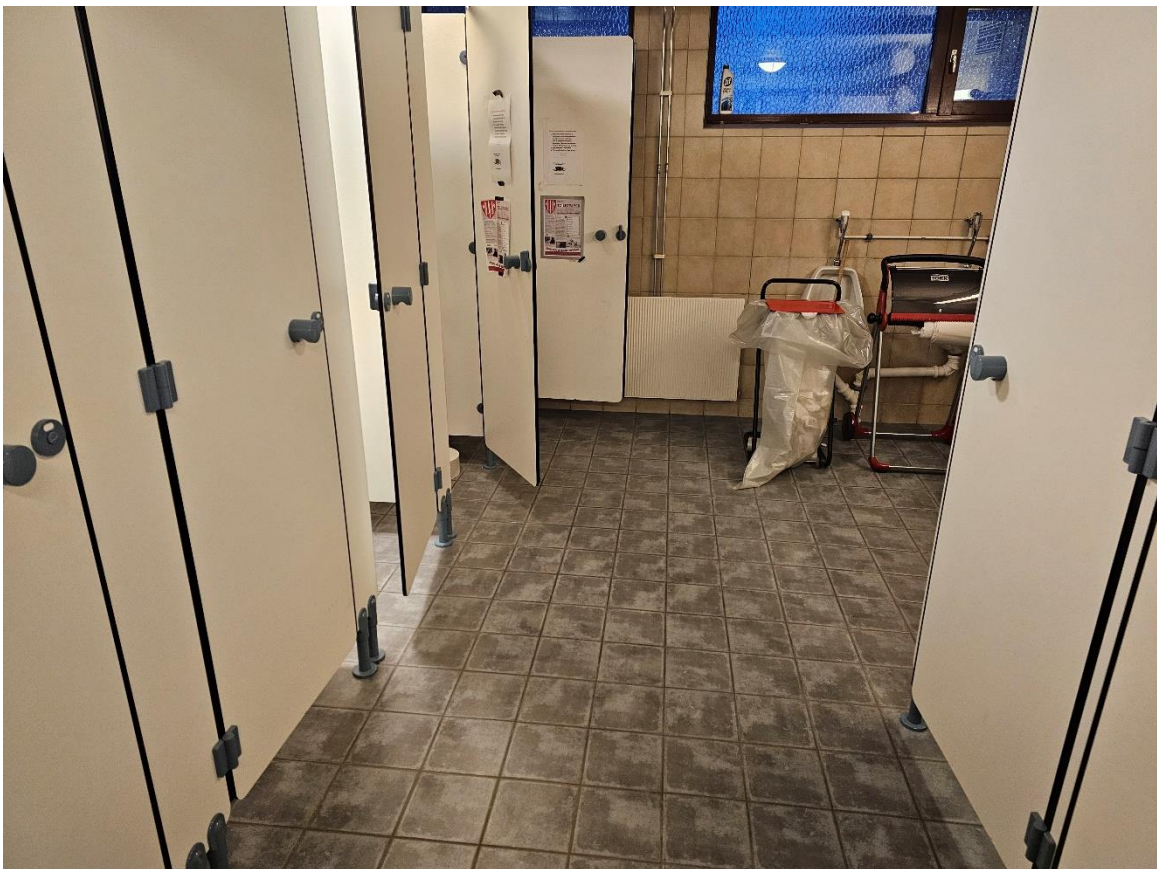
Bilde 6.2, viser toalett «Damer» i kjeller.