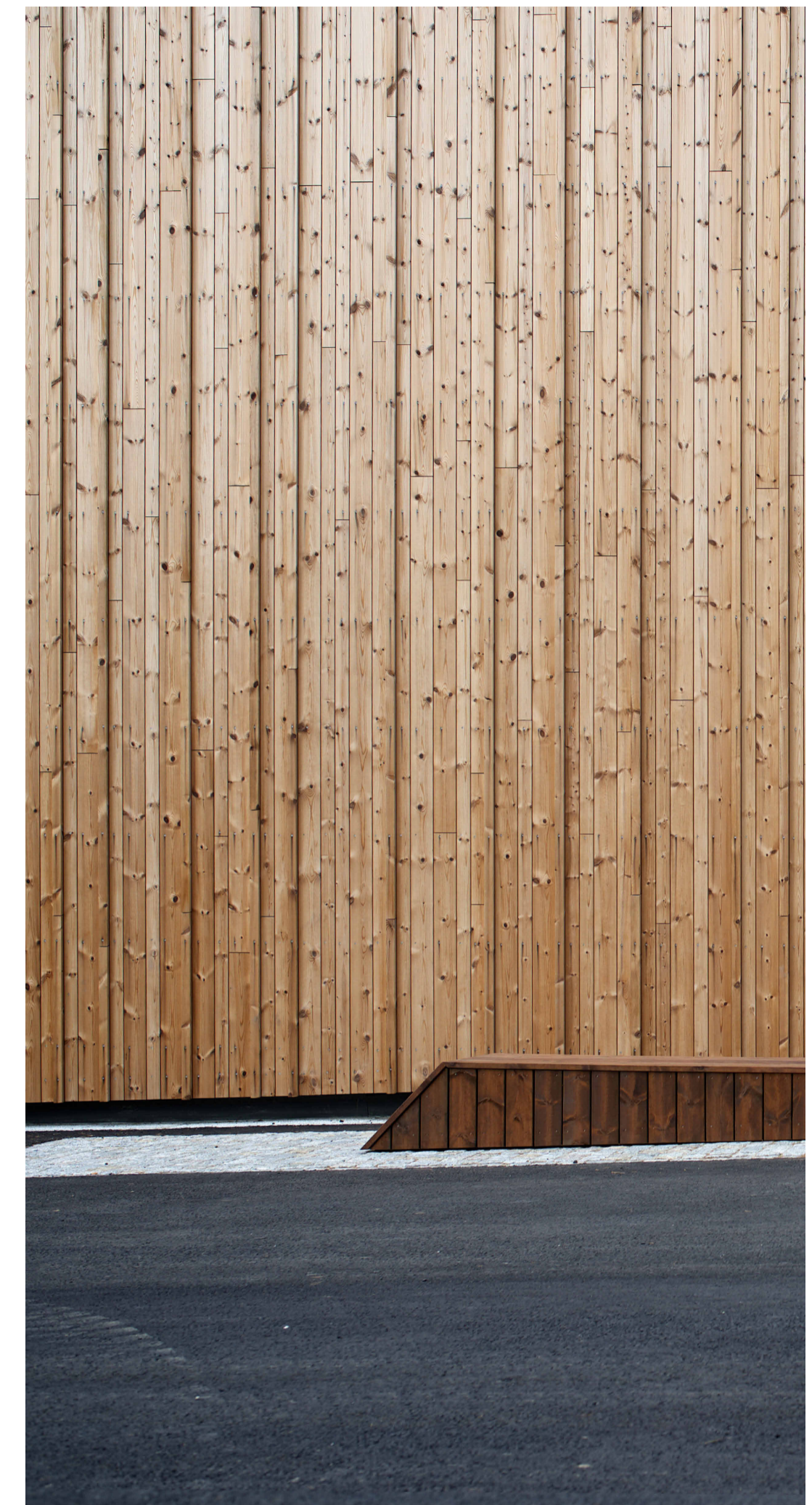
Referense: Kledning Vossabadet