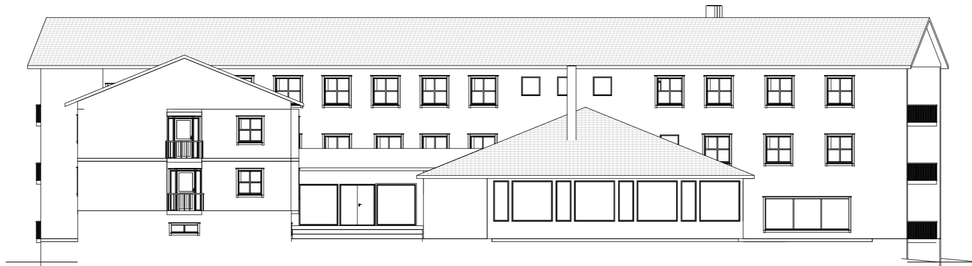
Fasade 3 1 : 200