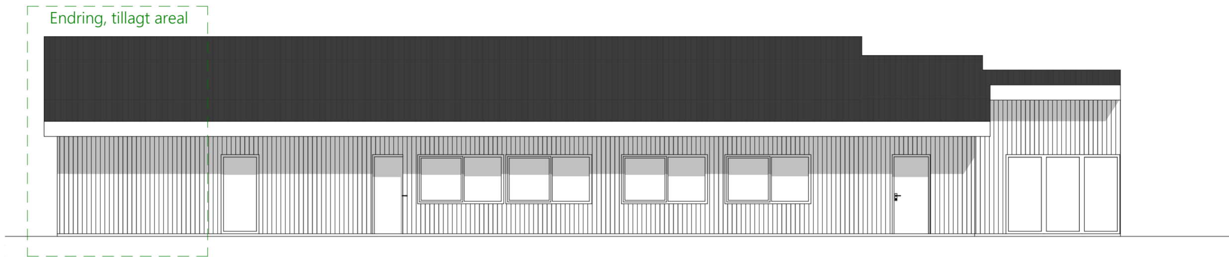
1:100 Fasade 02