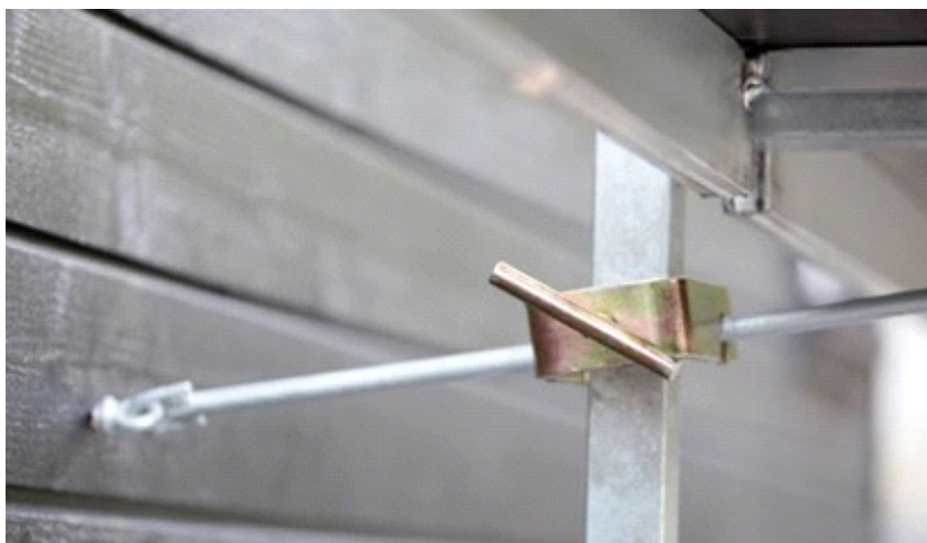
Eksempel på veggfeste. Veggfester skal være festet i spir eller ramme så nært knutepunkt med lengdebjelker som mulig.

Vær oppmerksom på at dokumentet kan være endret etter utskrift.