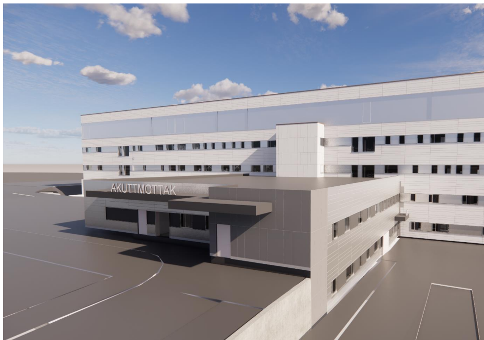
Figur 1 Tilbygg for UAM og nye MR-maskiner

Tilbygget er plassert mot fasade som vender mot parkeringsplasser og E6. Tilbygget skal bygges i to plan hvor 1.etg. skal omfatte MR(MR4) og 2 etg. skal omfatte akuttmottak (UAM). UAM blir da en forlengelse av samme funksjon i eksisterende sykehus, Bygg08.