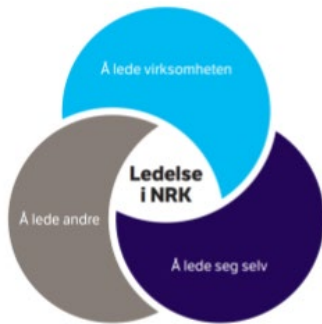
Figur 1 NRKs lederprinsipper

Det forventes at alle tilbudte personer skal reflektere NRKs kjerneverdier, som er åpne, modig og troverdig. Prosjektet skal være et åpent og tilgjengelig prosjekt, og alle som jobber i prosjektet skal ta miljøhensyn i alle beslutninger og stille høye krav til oss selv og våre samarbeidspartnere.