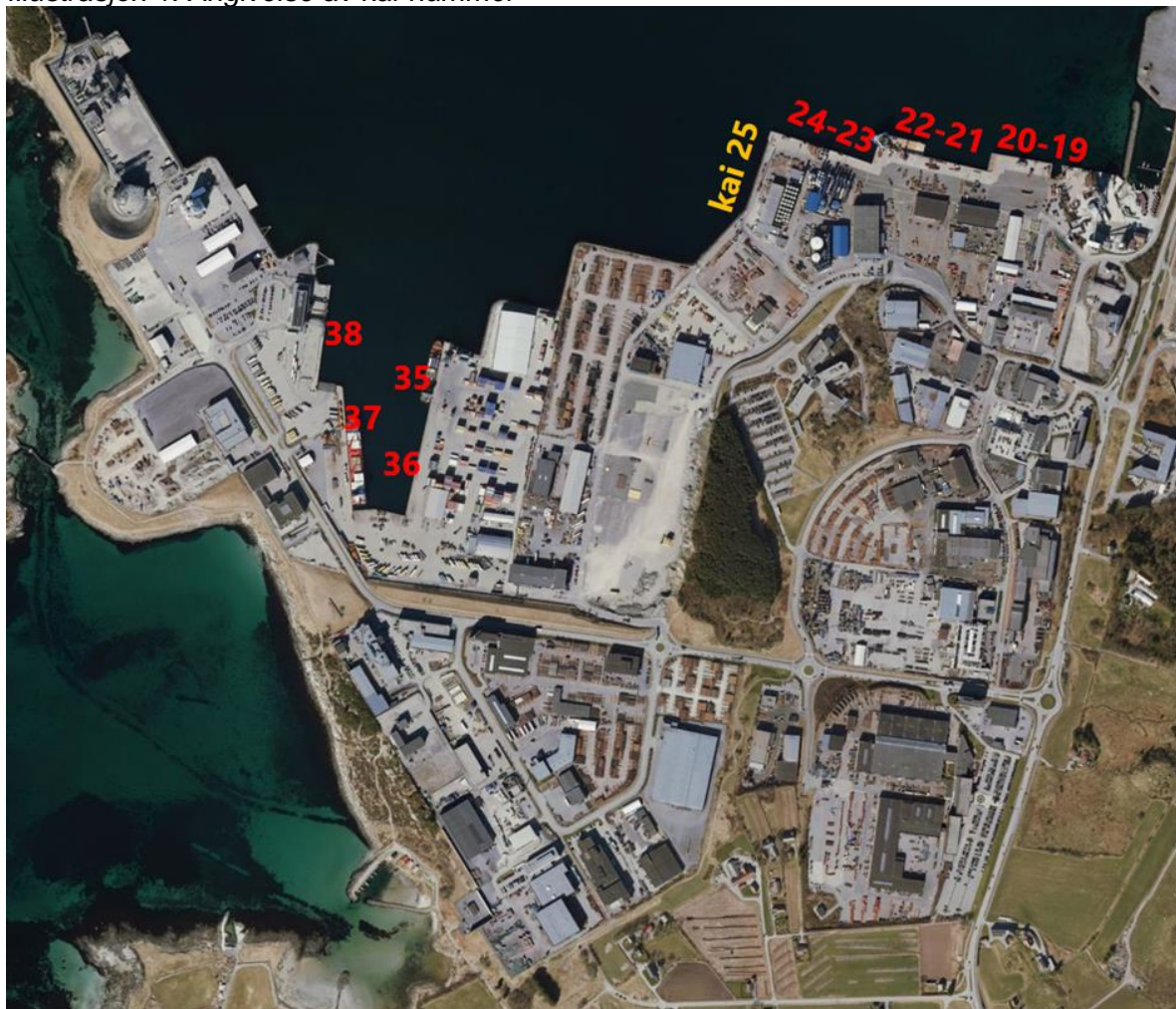
Illustrasjon 1: Angivelse av kai-nummer

Leverandøren skal gi tilbud på totalentreprise i samsvar med havneskisse som følger konkurransegrunnlaget, se bilag 1.1 og 1.2 til V-1 Ytelsesbeskrivelse. Utformingen er gitt av behov for en forlengelse av kai 24 og en fremtidig mulighet til et byggetrinn to, med forlengelse av kaien i rett linje mot sør. Se illustrasjon 2 nedenfor med eksempel på dimensjonerende bruk.