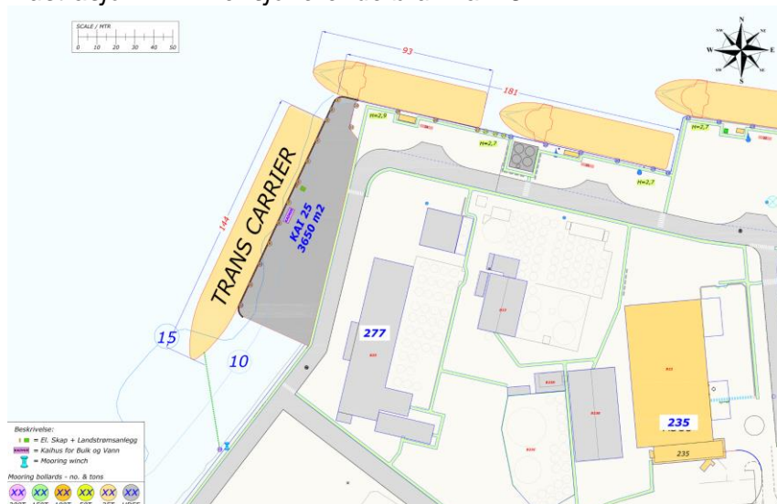
Illustrasjon 2: Dimensjonerende bruk kai 25

Nærmere informasjon om oppdraget og krav til leveransen fremgår av vedlegg V-1 Ytelsesbeskrivelse.