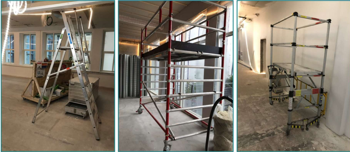
Figur 2 Eksempler på gode arbeidsplattformer, f.v.: Plattformstige, rullestillas, og rullestillas med teleskopfunksjon.