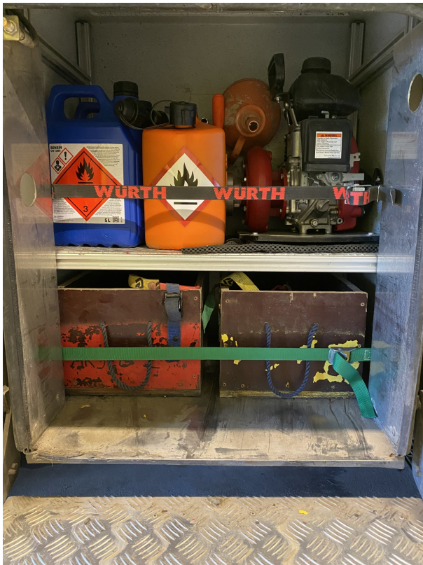
Utstyr Skap V.3:

- Kombikanne med fil og kombinøkkel til motorsag.