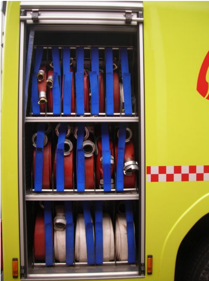
Utstyr Skap H.1: