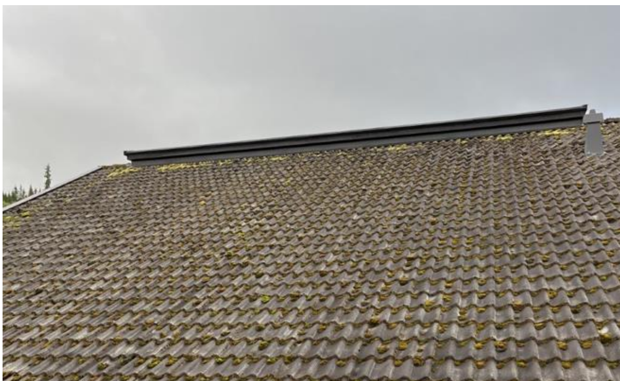
Bilde tatt fra nord.