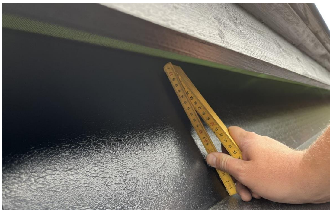
Blikk under kledning