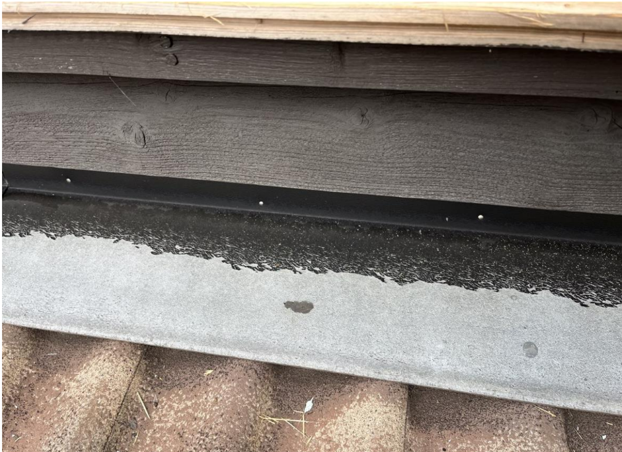
Bilde av kledning