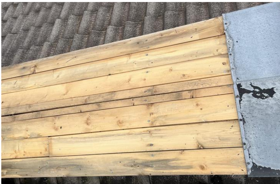
Bilde tatt ovenfra etter fjerning av blikk.