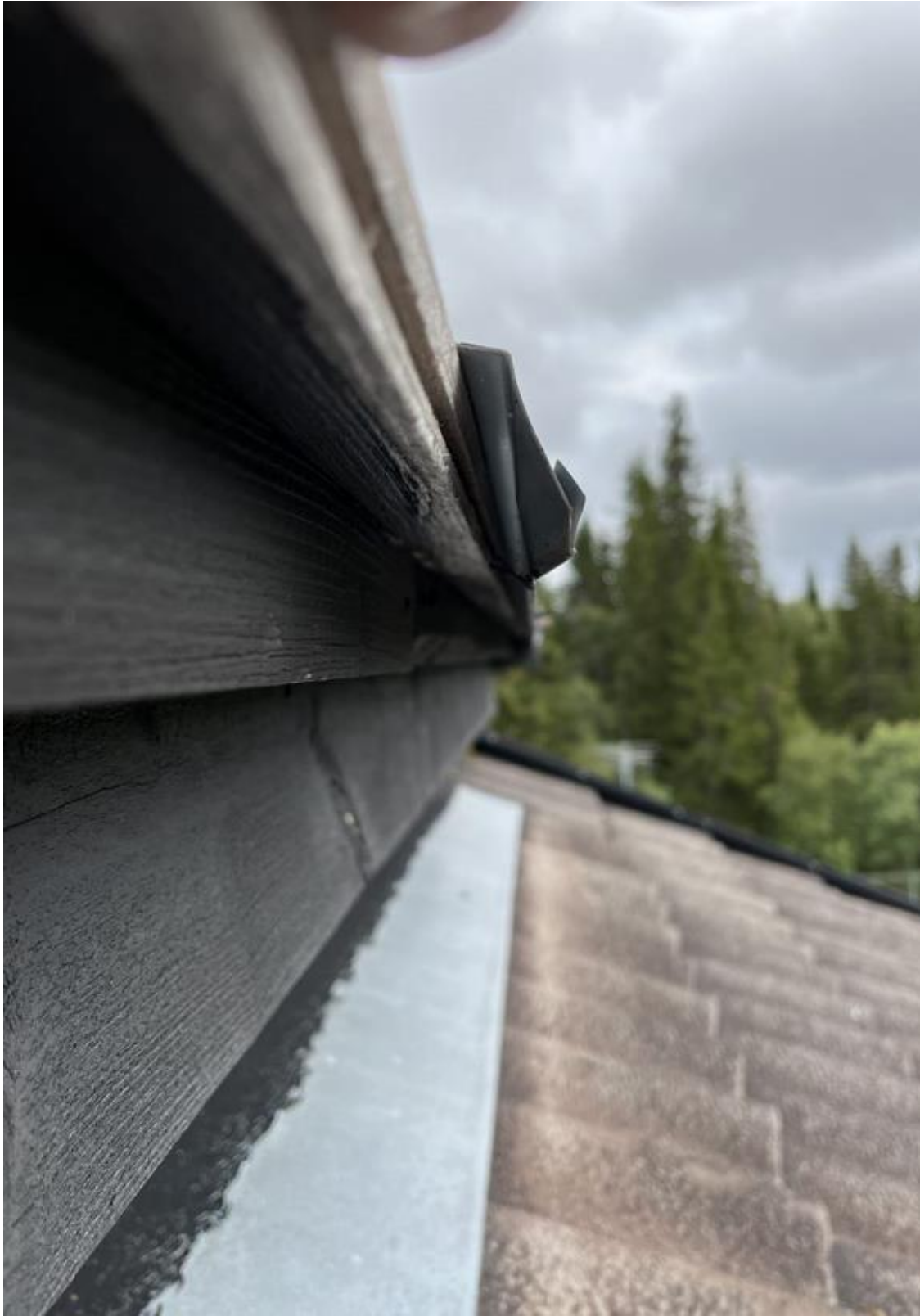
Bilde av kledning