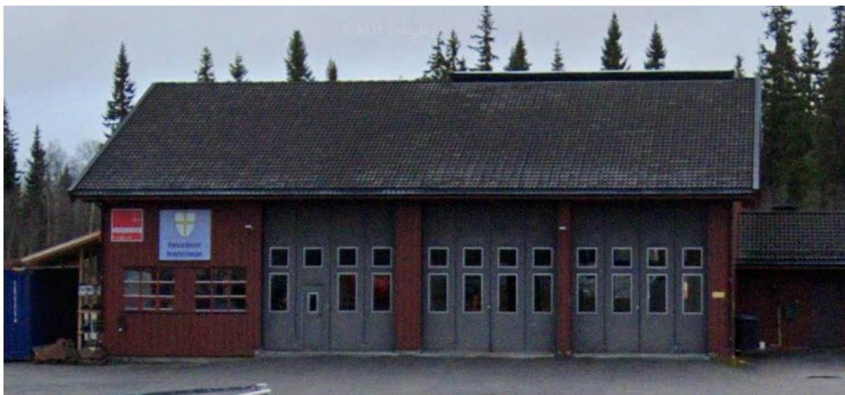
Kasse over de to portene til høyre i bildet. Bilde tatt fra sør.