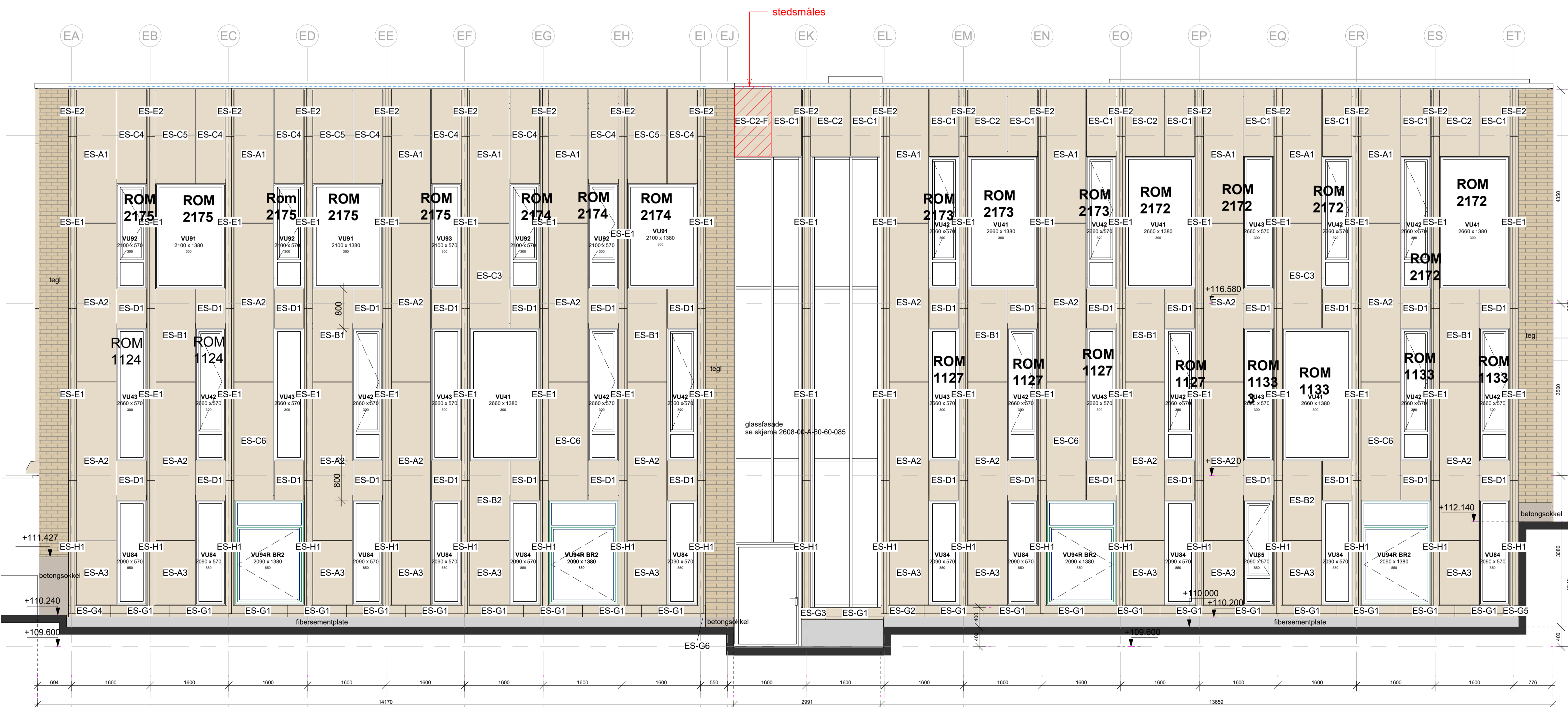
Fasade Bygg E syd 1 : 50

Markering av solavskjerming SOL DESIGN INT.ARK.MNIL 25.08.2023