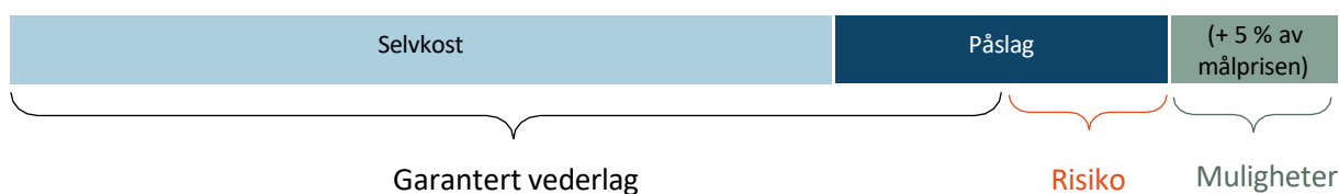
Figur 2: Totalentreprenørens risiko ved overskridelser og mulighet ved besparelser.

I utgangspunktet vil besparelsene eller overskridelsene fordeles mellom totalentreprenøren og byggherren med 50% hver, og komme i tillegg til – eller til fradrag i – totalentreprenørens påslag. Totalentreprenørens mulighet begrenses imidlertid av at totalentreprenøren ved besparelse maksimalt kan oppnå et tillegg tilsvarende 5 % av målprisen ved besparelser. Totalentreprenørens risiko ved overskridelser begrenses til et fradrag tilsvarende halvparten av påslaget ved overskridelser av målprisen.