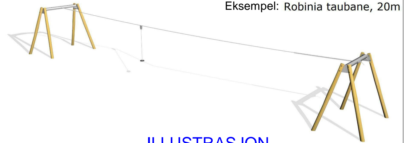
Eksempel: Robinia taubane, 20m