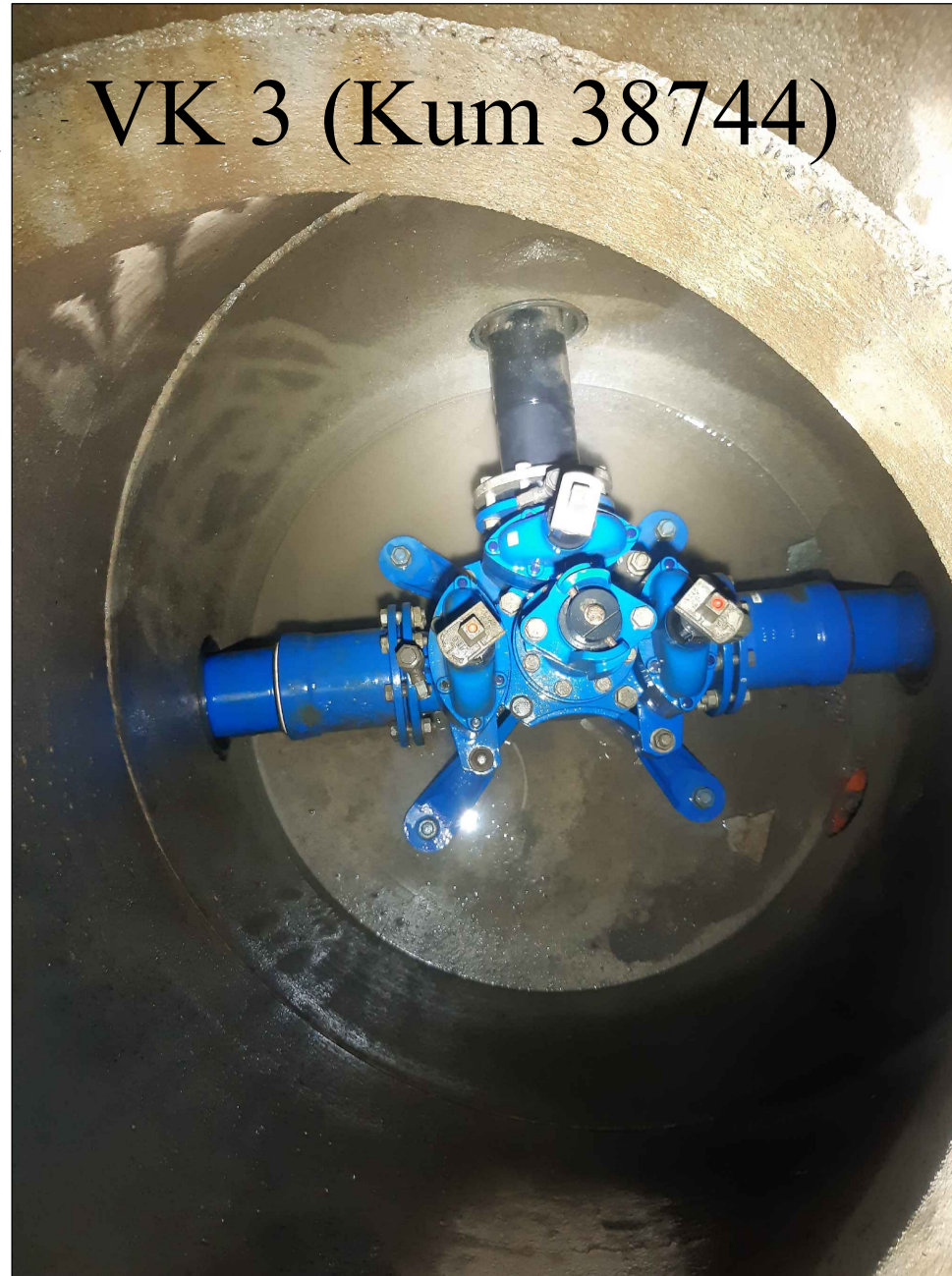
VK 3 (Kum 38744)

Nye materialer: Vannkum VK3 (kum 38744):