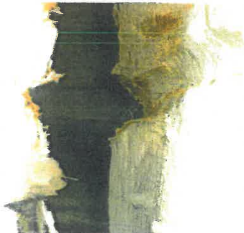
Yttervegg syd, laftet tømmerkasse skimtes bak kledningen.