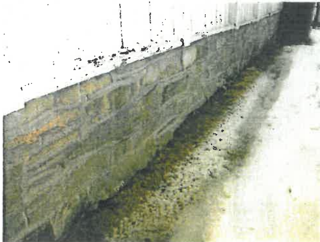
Tørrmurte gråsteinsmurer, fuget i ettertid.

Eiendom: KOMMUNE HØYLANDET Adresse: Høylandet Kirke, 7977 HØYLANDET