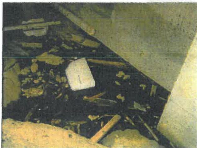
Fritt vann under våpenhus/tårn.