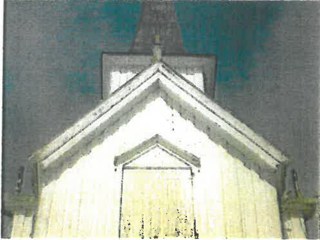
Tårnet mot vest.

Eiendom: KOMMUNE HØYLANDET Adresse: Høylandet Kirke, 7977 HØYLANDET