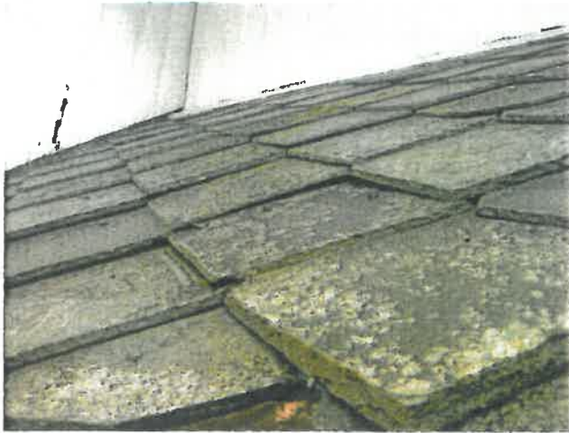
Taket mot øst over koret.

Eiendom: KOMMUNE HØYLANDET Adresse: Høylandet Kirke, 7977 HØYLANDET