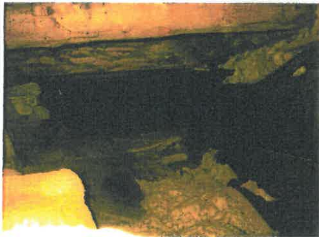
Grunnmur, samme parti, sett fra krypekjeller. (isolert med sydde matter)