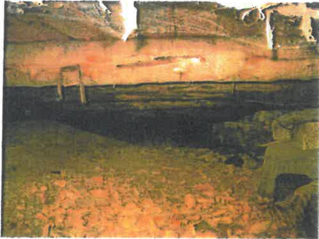
Gulvåser under kirkeskip, god forfatning.

Eiendom: KOMMUNE HØYLANDET Adresse: Høylandet Kirke, 7977 HØYLANDET