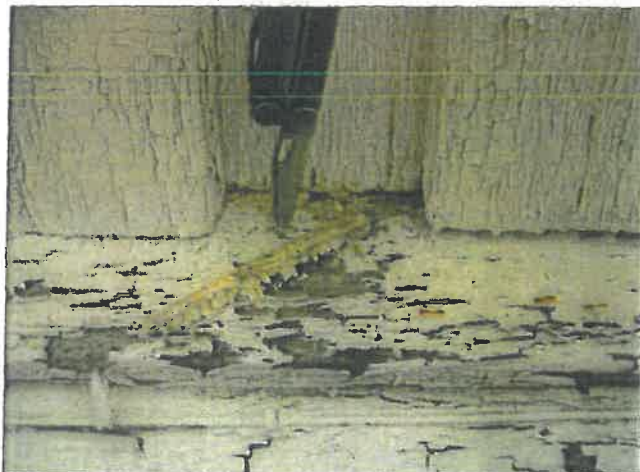
Nedre del av sydvegg/vannbord ved dåpssakristi.