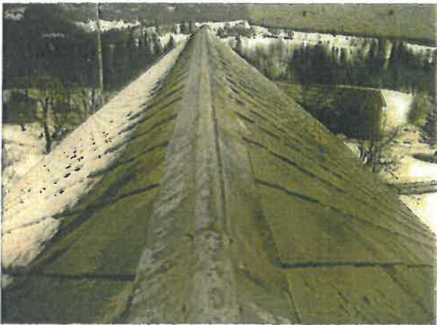
Taket over skipet.