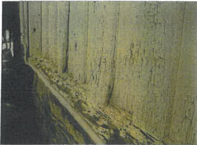
Nedre del av sydvegg ved dåpssakristi.