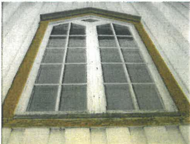
Sydvegg, vindu - vedlikeholdsbehov.

Eiendom: KOMMUNE HØYLANDET Adresse: Høylandet Kirke, 7977 HØYLANDET