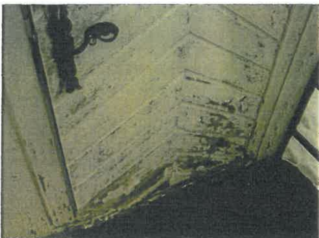
Ytterdør utgang fra kor - råteskader.