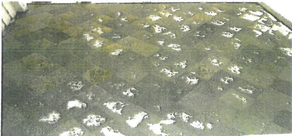
Taket over våpenhuset.