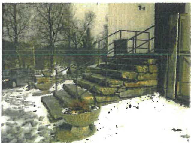
Tørrmurt trapp av gråstein.