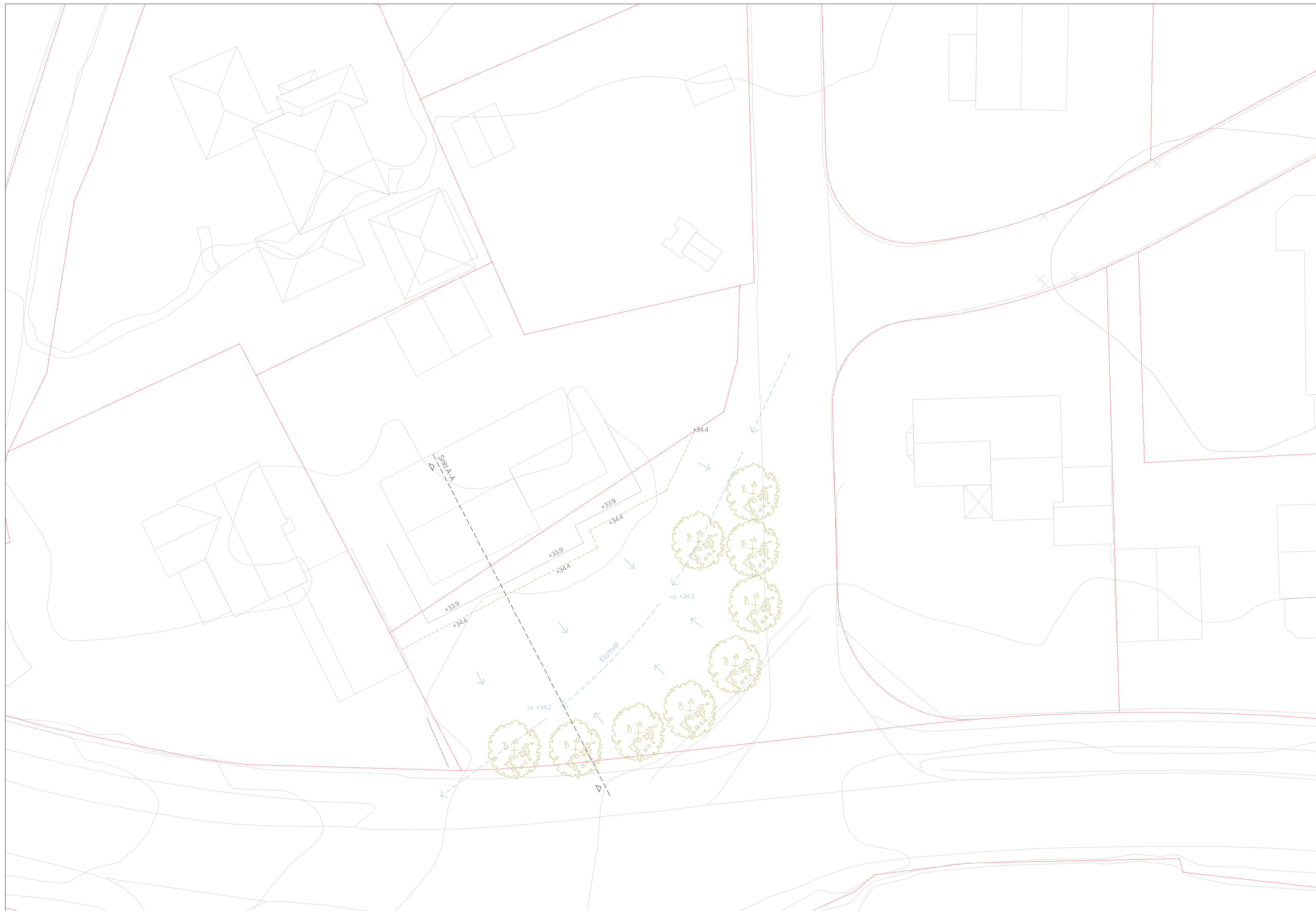
Snitt A-A 1:100