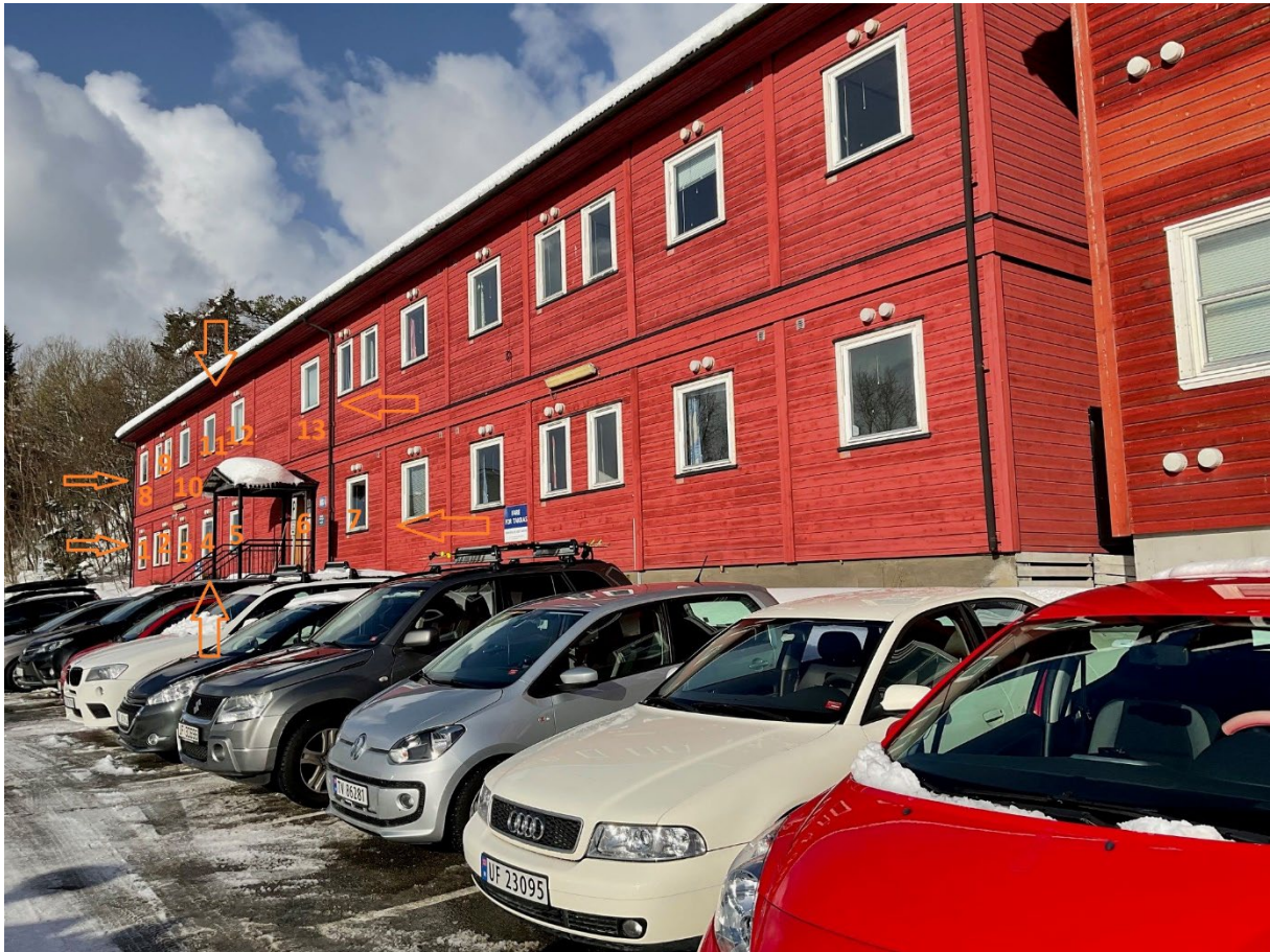
Fasade mot syd, oransje piler/nummereringer viser aktuelle brakker mot vest.