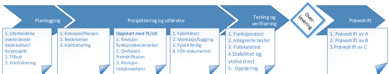
Figur 1 - Prosessen frem til overlevering og prøvedrift – for totalentreprise (NS8407)

Figur 1 nedenfor viser prosessen Systematisk ferdigstillelse fra planlegging til ferdig prøvedrift.