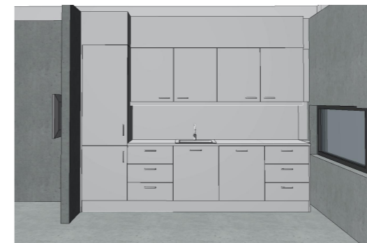
VISUALISERING Profiling er ikke medtatt i visualisering.