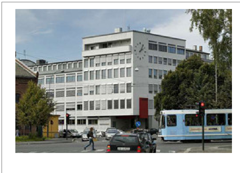
Bilde: Patentstyrets kontorbygg i Sandakerveien 64.