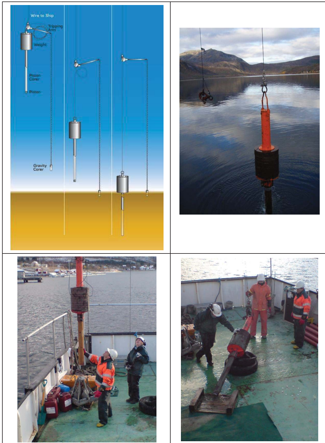
Figur 3 Prinsippskisse for prøvetaking med «pistoncorer», samt Multiconsults «pistoncorer» i bruk.

Kjerneprøven blir kvalitetsvurdert av miljøgeolog som bestemmer om prøven er godkjent eller underkjent. Ved for eksempel manglende fylling i sylindern, tydelige spor av utvasking av prøven, mistanke om at overflaten av prøven er forstyrret eller annet, blir prøven forkastet og ny prøve tas.