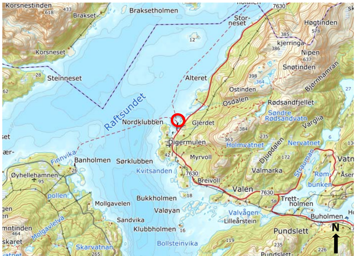
Figur 1: Digermulen. Undersøkt område er markert med rød ring.

Multiconsult har utført miljøgeologisk prøvetaking av sjøbunnsediment i aktuelle tiltaksområder. Denne rapporten inneholder resultatene fra den miljøgeologiske undersøkelsen.