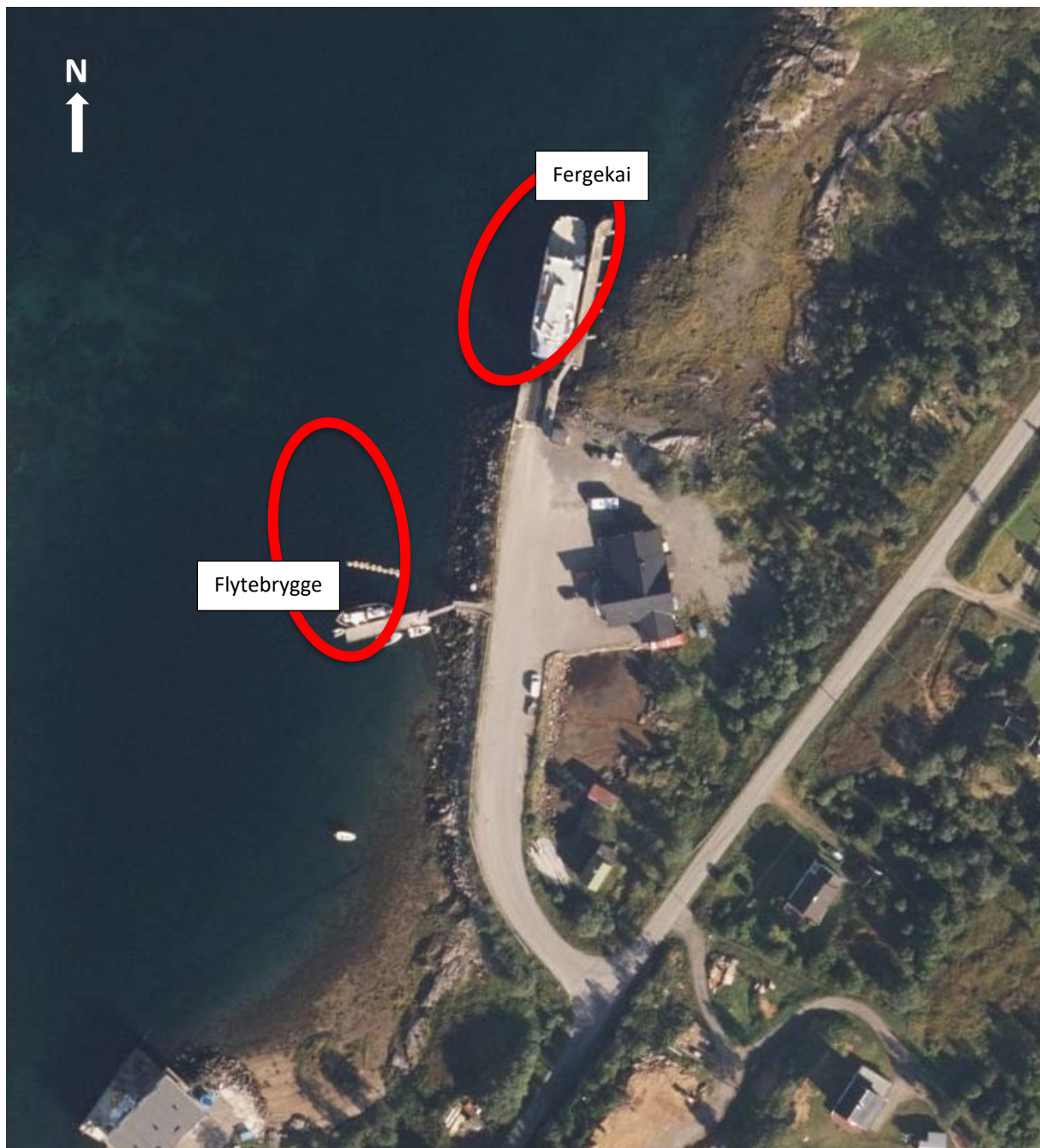
Figur 2: Digermulen. Undersøkte områder ved Digermulen fergekai, er markert med rødt.

De undersøkte områdene ligger ved Digermulen fergekai i Raftsundet, Vågan kommune, i Nordland fylke, se figur 2. Undersøkt område i nord er ved dagens fergekai, mens undersøkt området i sør er ved en kommunal flytekai. Litt lengre inn i bukta sør for fergekaia er det en privat kai samt et mindre båtverksted med slipp.