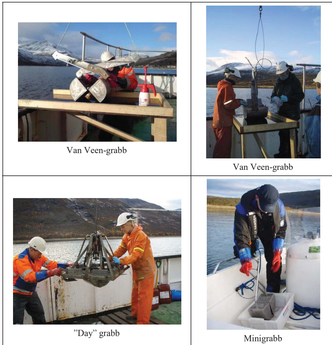
Figur 2 Standard van Veen-grabb med «inspeksjonsluker» hvor prøver blir tatt ut, «day» grabb på stativ og håndholdt minigrabb.

Multiconsult har flere standard van Veen-grabber og minigrabber i tillegg til en større grabb på stativ («day» grabb). Prøveinnsamling kan utføres med en av disse grabbene, avhengig av bunnforhold og tilgjengelighet for prosjektet. Grabbene er vist i figur 2.