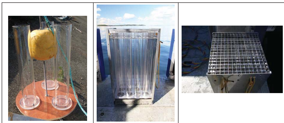
Figur 1 Eksempel på utforming av sedimentfeller. Bildet til venstre viser standard sedimentfelle som plasseres på bunnen eller i vannsøylen. Bildet i midten viser større sedimentfeller for plassering på bunn og detalj som viser åpning med strømdemper er vist i bildet til høyre.

Sedimentfeller benyttes til innsamling av partikler som sedimenterer ut fra vannmassene (figur 1). Disse kan plasseres på bunnen eller i definerte nivå i vannsøylen. Ved uttak av sedimentert materiale fra fellene blir fritt vann over prøven (sedimentene) forsiktig dekantert ut før prøven blir overført til rengjorte og forbehandlede beholdere i tråd med planlagt analyseprogram. Eventuelt benyttes destillert vann eller sjøvann fra lokaliteten for å skylle ut alt prøvematerialet.