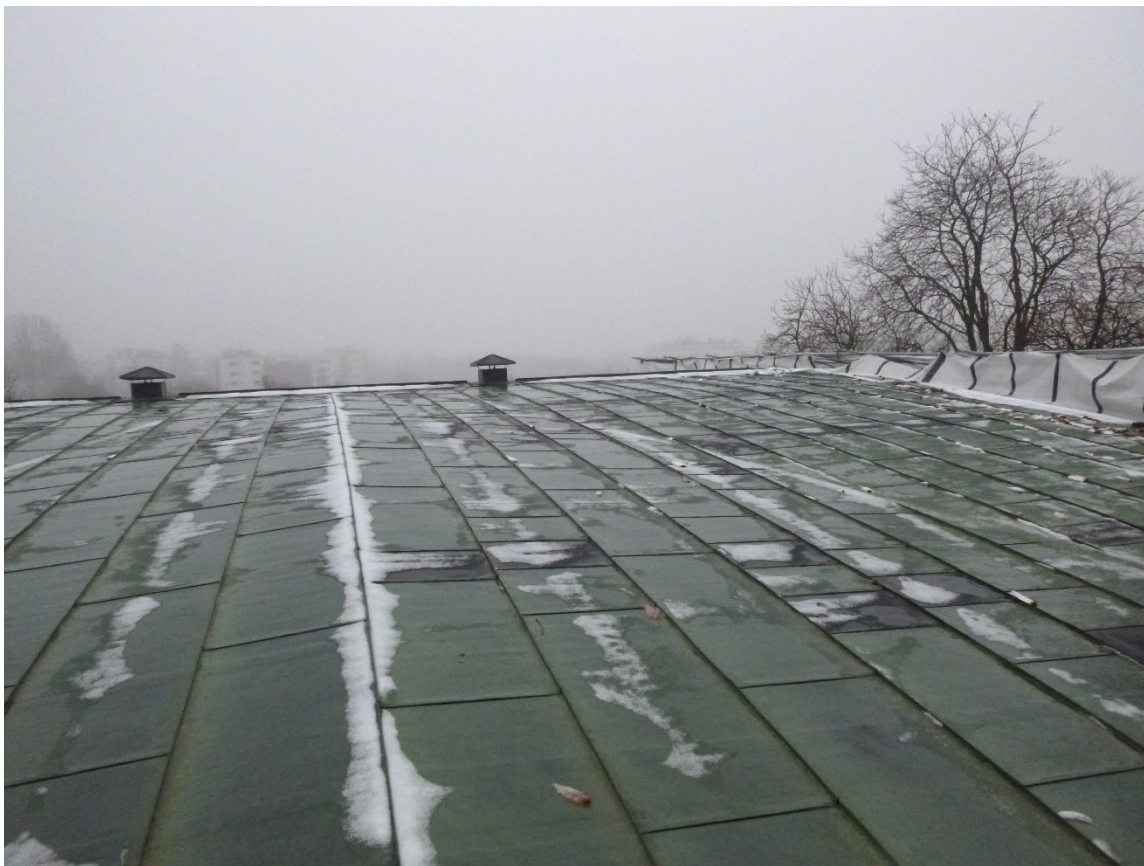
Takflaten sett mot toppen. Ny luftelyre skal etableres på samme sted som eksisterende.