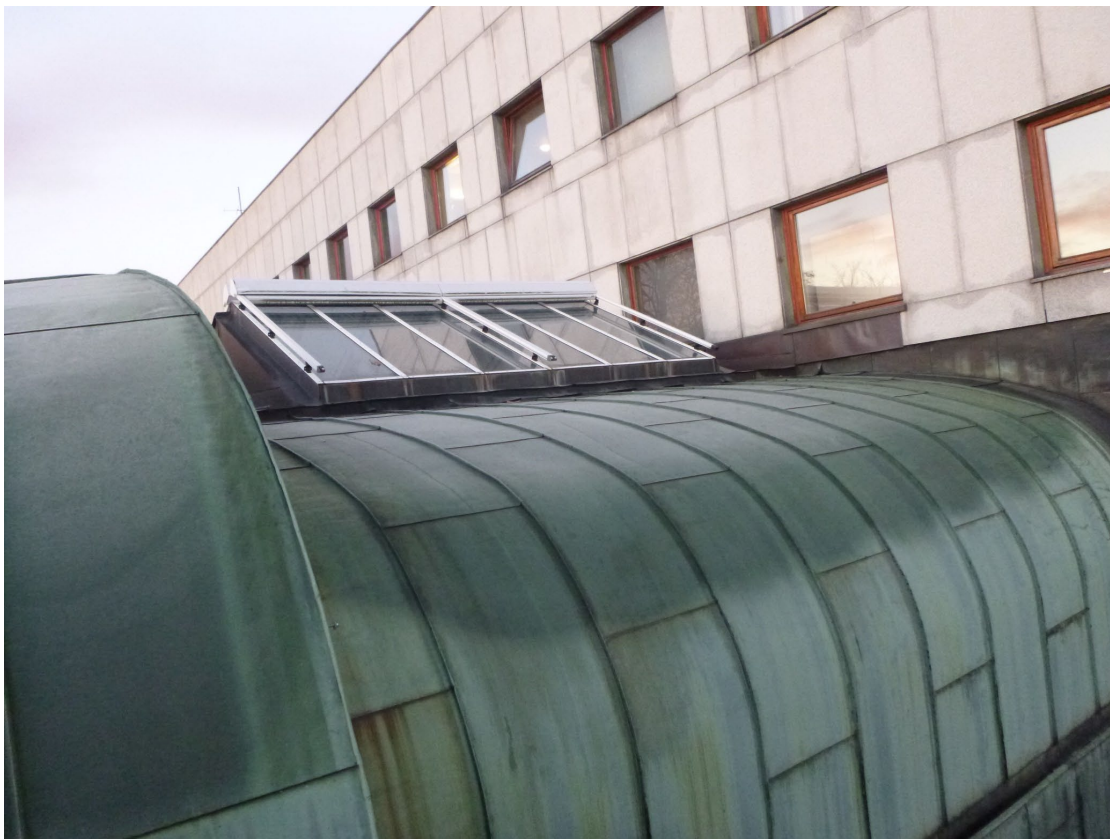
Overlys på halsen.