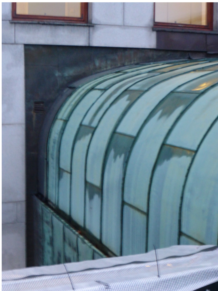
Halsen inn mot hovedbygget