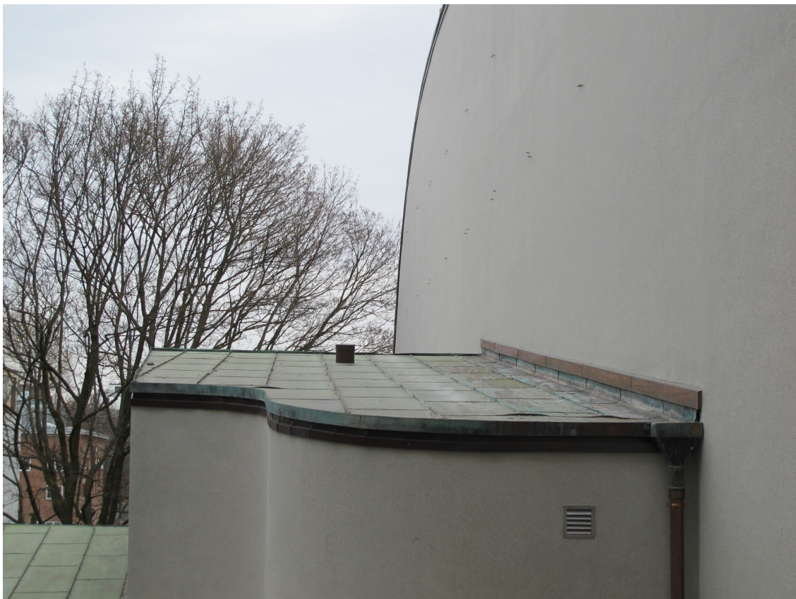
Lavt tak på siden mot sydvest.