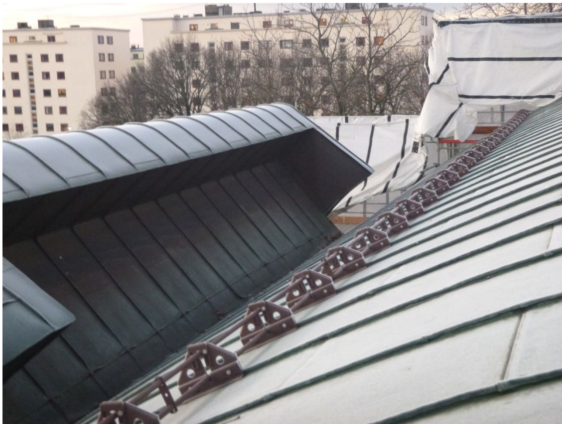
Toppen av ryggsekken. Her skal det etableres ny renne for å lede vannet ut på sidene.