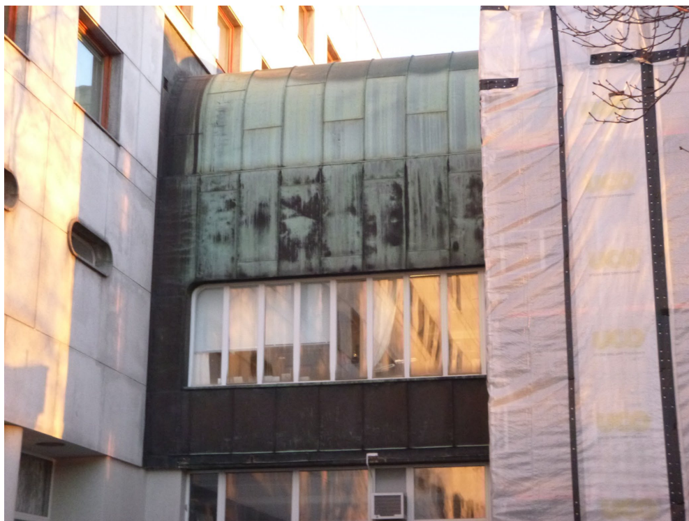
Halsen mellom hovedbygget og Store studio