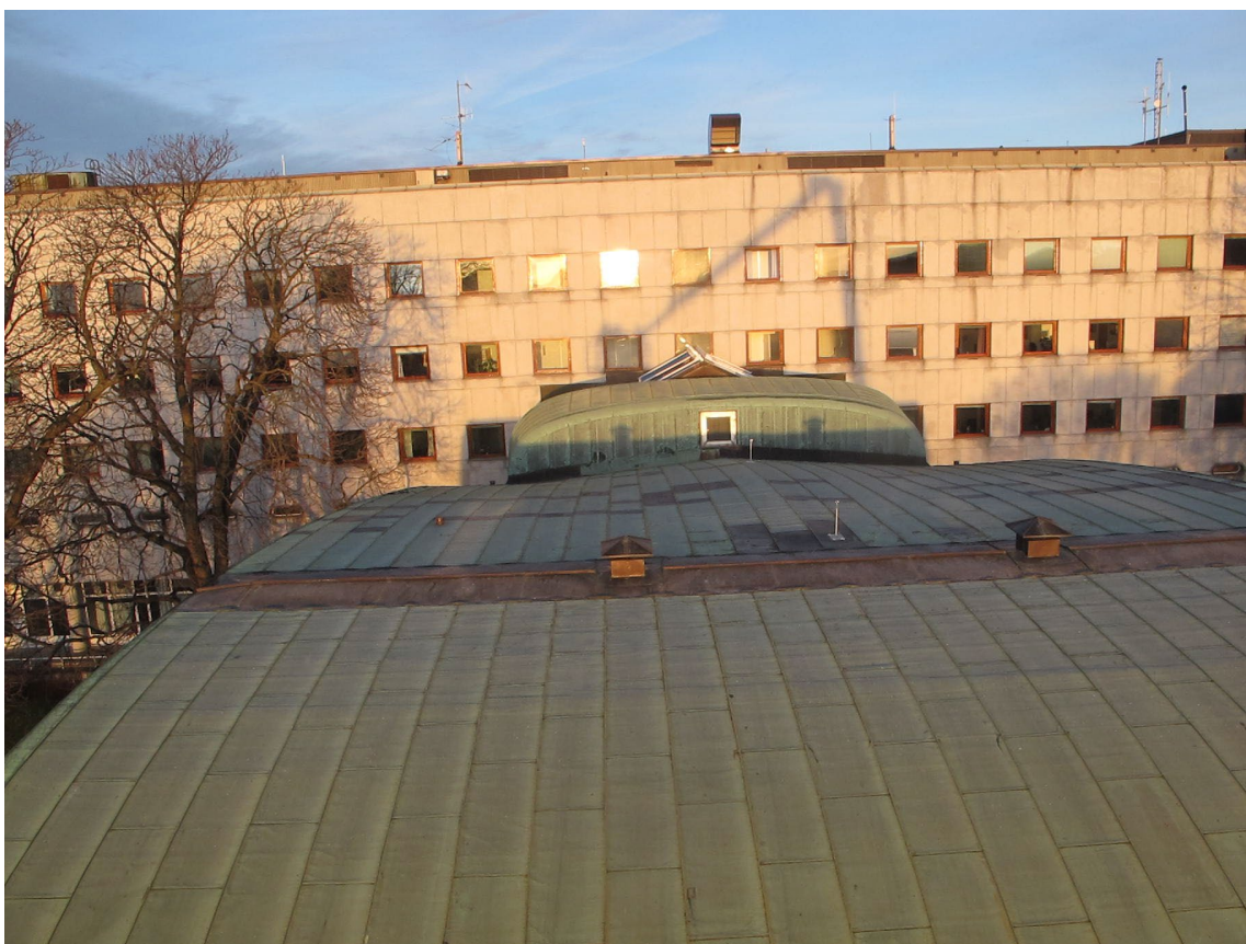
Oversikt over taket sett mot hovedbygget. Denne flaten skal heves og det skal etableres kilrenner.