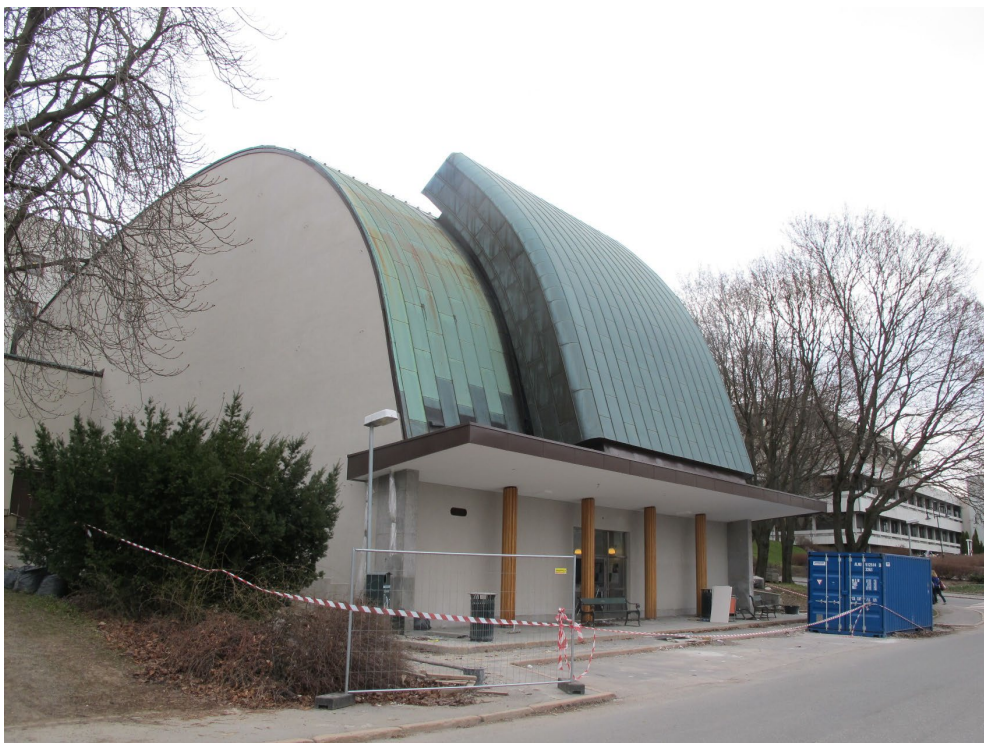
Inngangsparti. Ryggsekken og det flate taket over inngangen.