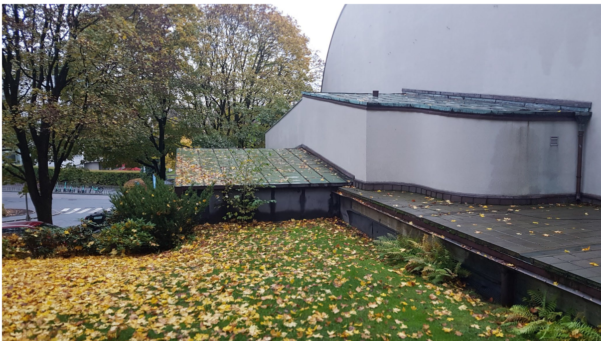
Begge de lave takene på siden mot nordøst