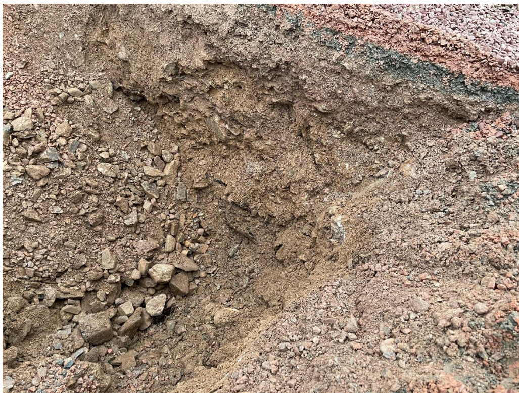
Figur 3 Prøvegravehull P1 (1,4 meter dypt)

Hullet besto av ca. 10 cm rød singel på toppen, og ellers noe som fremsto som tilførte masser. Det ble tatt en prøve i bunnen av hullet, og massene ble klassifisert som «Sandig grus». Prøvegravingen ble stoppet etter 1,4 meter, da det ble ansett som tilstrekkelig dypt for fundamentering av fremtidig bygg.