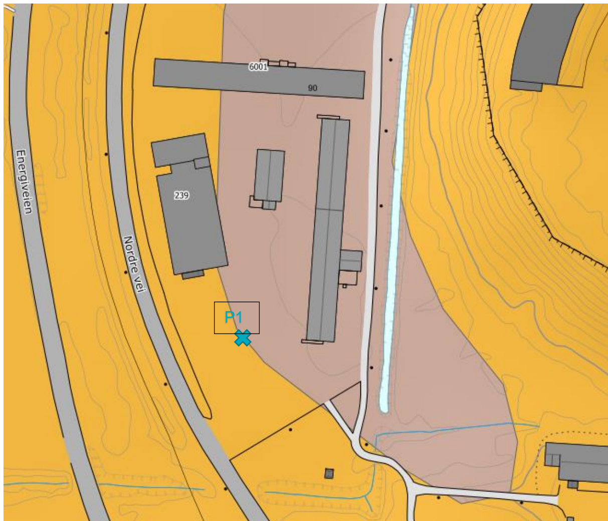
Figur 2 Utdrag fra løsmassekartet til NGU med markert prøvegravingspunkt P1

« Organisk jord dannet av døde planterester, med mektigheter større enn 0,5 m. Det skilles ikke mellom ulike torvtyper. »