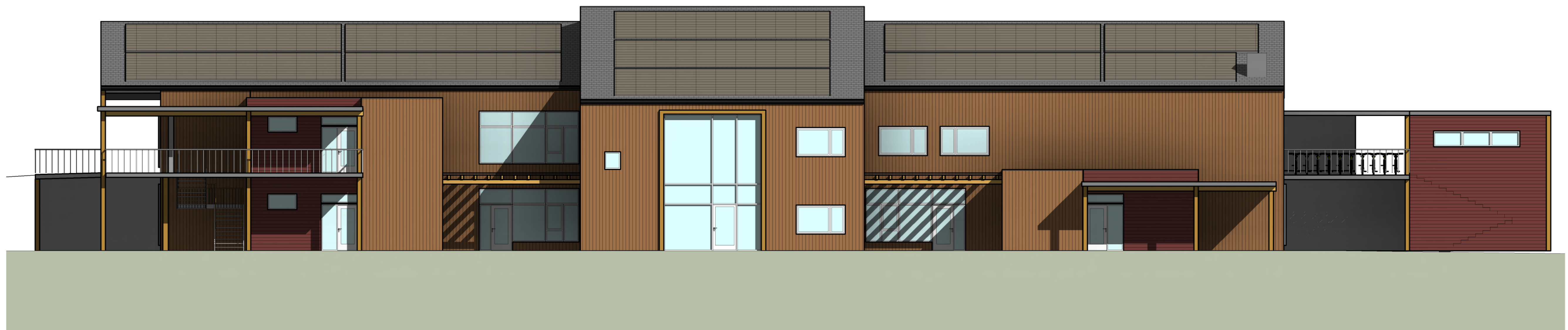
Fasade Sør 1:100

Solceller på tak mot sør er kun vist som prinsipp