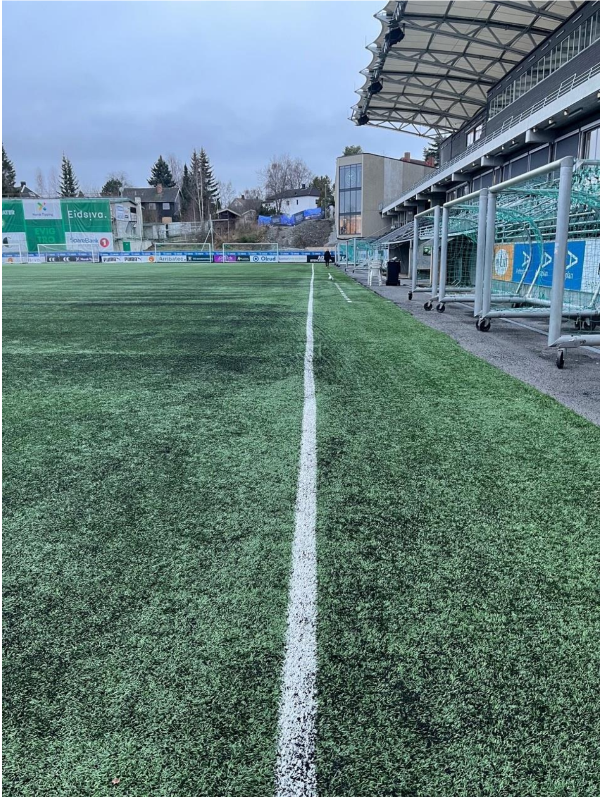
Figur 8 Oversiktsbilde, mot sør ved langsiden mot hovedtribunen