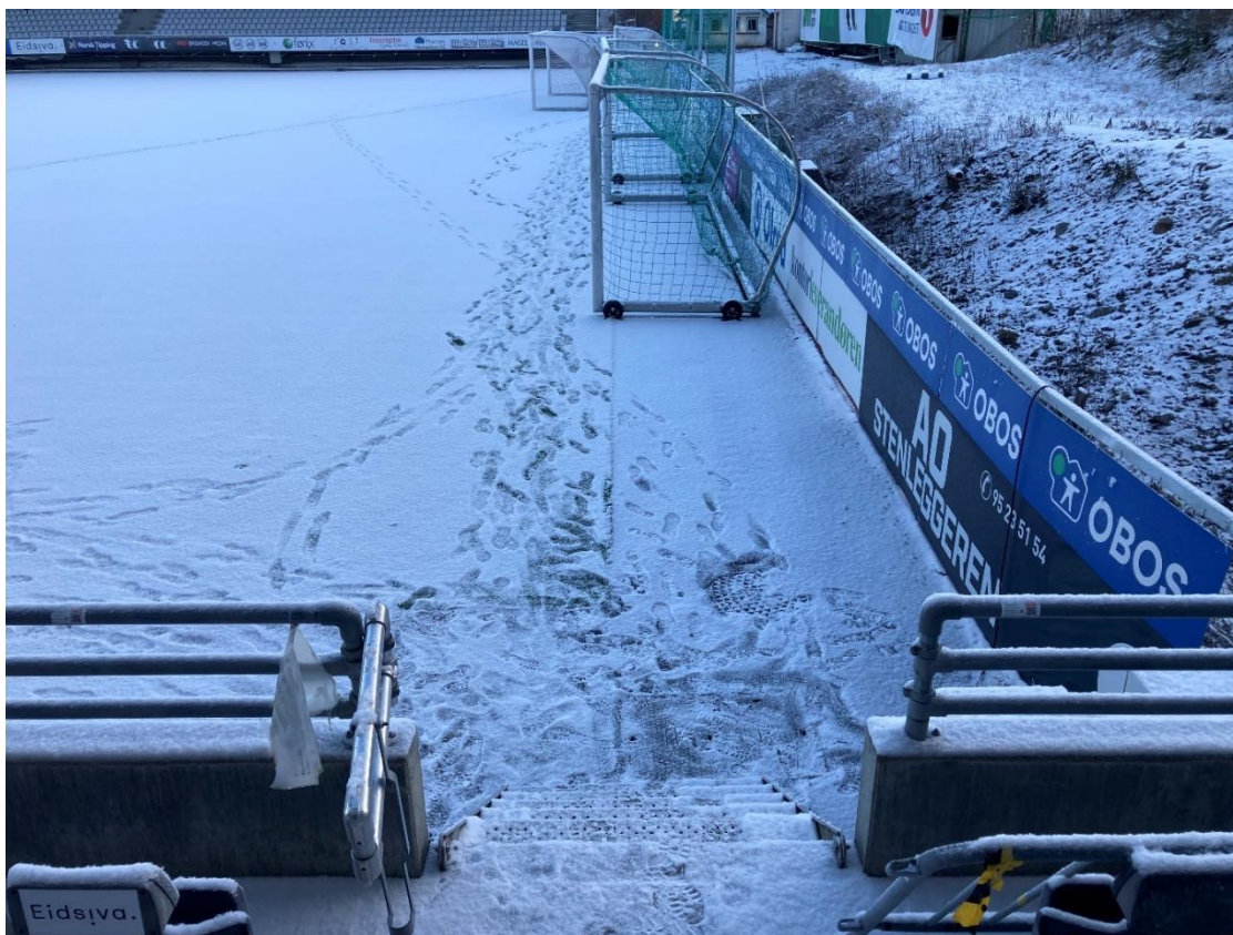
Figur 12. Vinterbilde fra kortsiden mot sør. 2m asfalt som erstattes med kunstgress og avsluttes mot gjerde/ballfangnett. Rør til vanningsanlegg legges under der asfalten nå ligger. Samlerør for undervarmeanlegget ligger også i dette området.