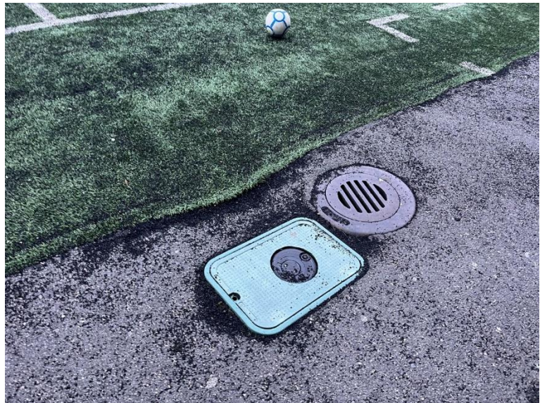
Figur 6 og 7 To av totalt 10 spredere langs banen som skal fjernes. Nye spredere, 4 på hver side, blir liggende i den nye kunstgress sonen. Enkelte sluk i asfaltsonen vil også bli liggende i den nye kunstgress sonen.