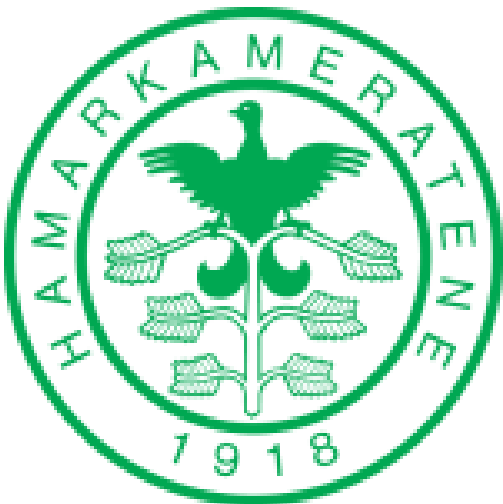
Fig 17 HamKams klubbblem som skal inn i kunstgress i spillertunnel.