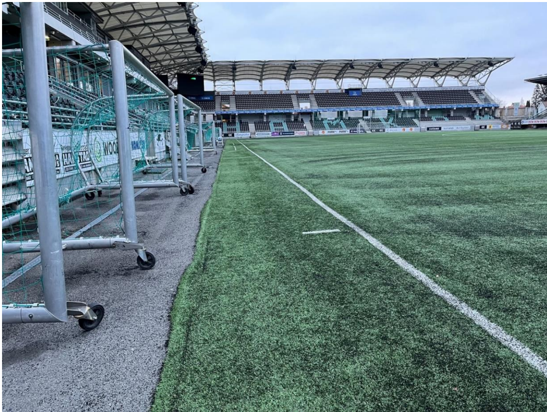
Figur 2. Langsiden mot hovedtribunen. Asfalten mellom kunstgress og dreneringsrennen. Her fjernes asfalt og vanningsanlegg legges. Nytt kunstgress legges helt ut til dreneringsrennen. Asfalten innenfor beholdes.