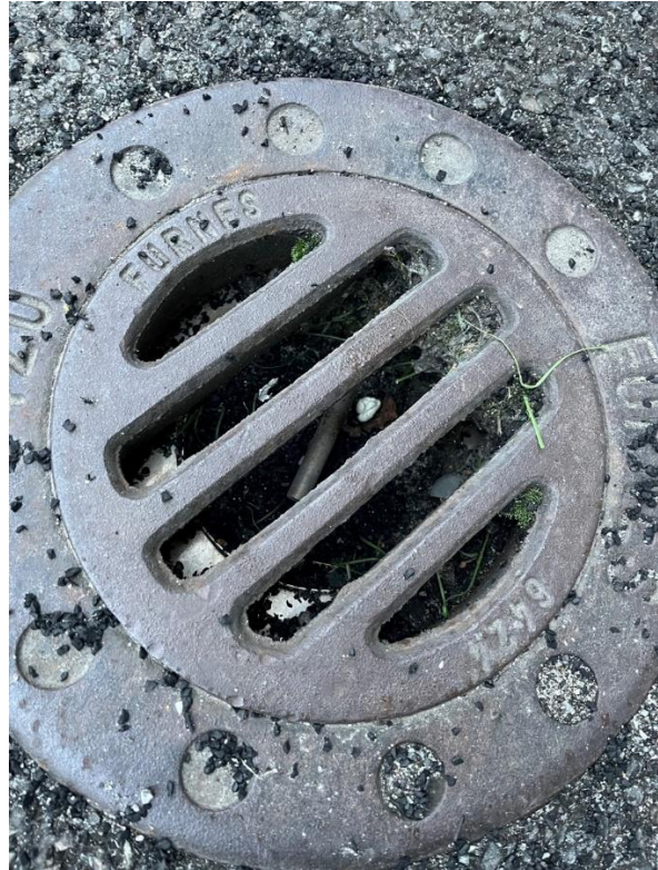
Figur 4 og 5 Tiltak for granulat på avveie. Rist med benk for å børste av seg granulat og evt skifte sko/strømper. Granulatfilter i alle overvannsluk