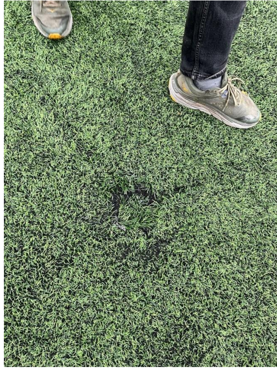
Figur 15 og 16 To spredere ute på banen som fjernes.