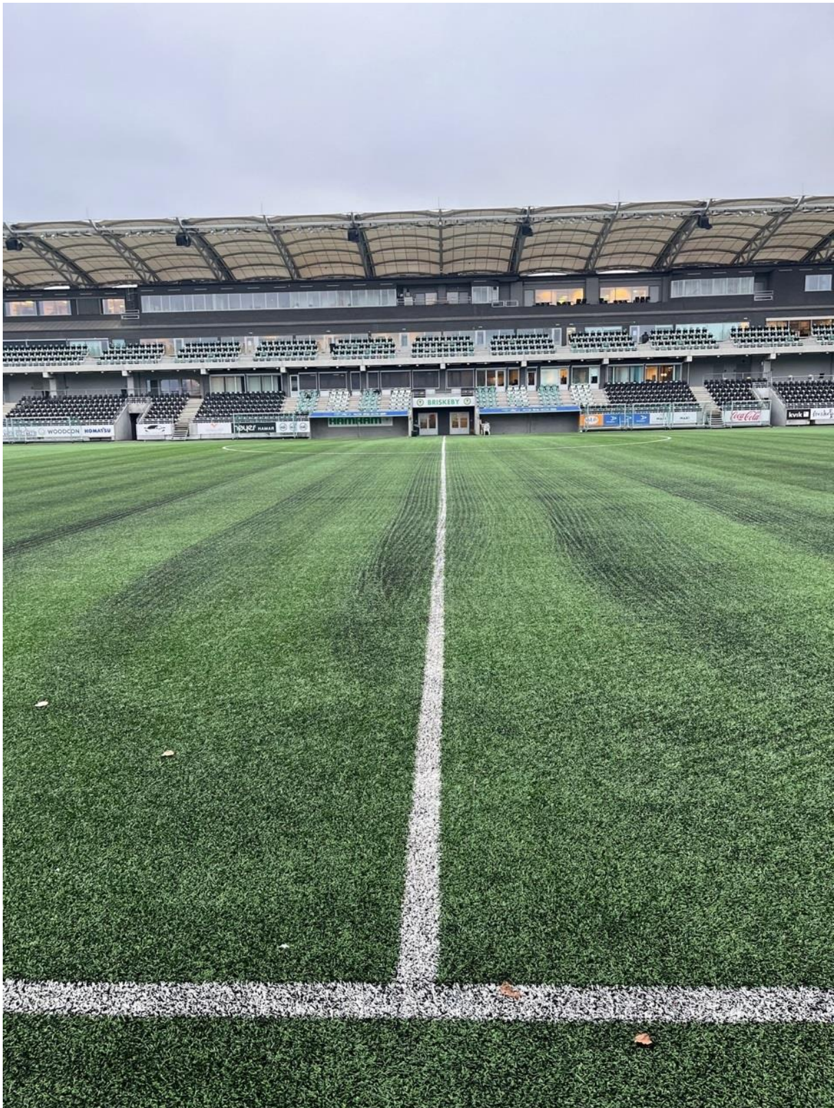
Figur 1 Oversiktsbilde mot vest.