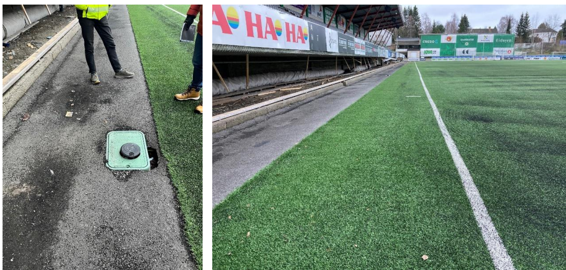
Figur 13 og 14 På østsiden mot den gamle tribunen som nå pr 22.01.23 er revet og hvor det bygges ny. Tribunen kommer 5,5m fra sidelinjen og det legges kunstgress helt ut. Nåværende asfalt og kantavslutning fjernes og vanningsanlegget med spredere legges her.